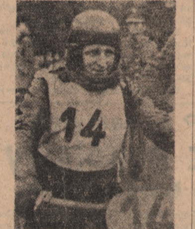
wany do OWKS, gdzie jako instruktor motorowy, w ramach współzawodnictwa przeprowadzał szkolenie w LZS-ach.