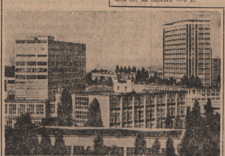
Nowoczesne miasto przemysłowe Czechosłowacji, które ku czci zasłużonego prezydenta republiki czechosłowackiej nosi nazwę Gottwaldowo.