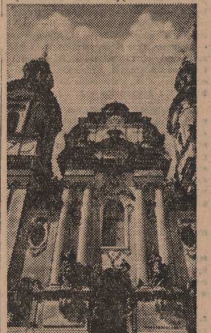
Cennym zabytkiem jest praski kościół św. Mikołaja

wiejski i przemysłowy. Zarząd zamków i grodów historycznych stara się o ich konserwację i utrzymanie