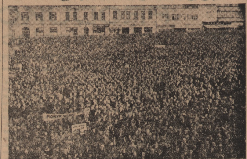
Ogólny widok zgromadzenia pokojowego w Gottwaldovie (Morawy), na którym 30.000 ludzi wyraziło swą niezłomną rolę obrony pokoju i praw ludu pracującego.

Około 15.000 delegatów wzięło udział w 14 okręgowych konferencjach obrońców pokoju, które odby-