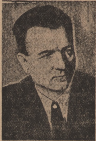
Klement Gottwald Prezydent Czechosłowacji (Czechosłowacji poświęcamy dziś trzecią stronę naszego pisma).