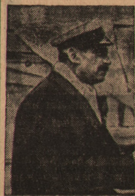
Król duński Krystjan

Stolica Krystjanji otrzymała dawną nazwę Oslo, a pierwotny język norweski, t. zw. „landsmål”, który w okresie panowania duńskiego spadł do roli dialektu, zyskuje coraz większe znaczenie jako język literacki.