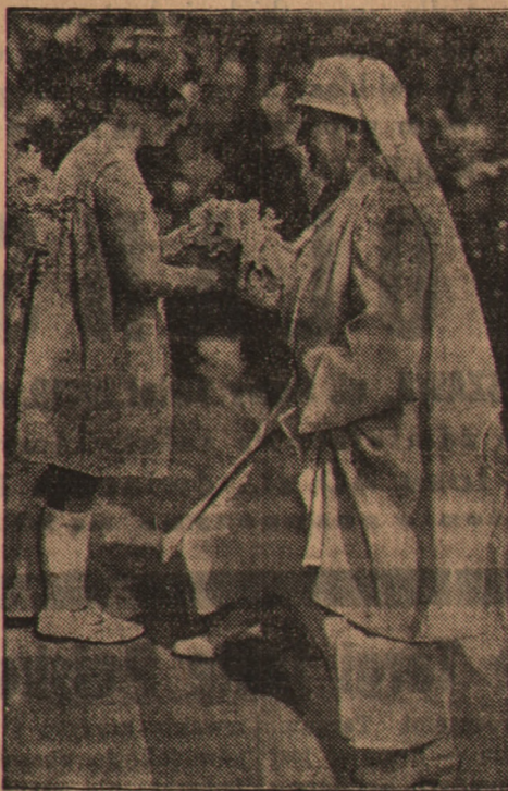
Królowa holenderska Wilhelmina