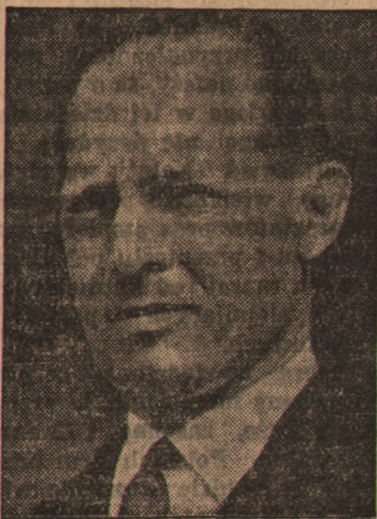
Król grecki Jerzy

Król grecki Jerzy II przed kilku dopiero tygodniami powrócił na tron po kilkuletnim wygnaniu z kraju, podczas którego przebywał przeważnie w Anglii. Po raz pierwszy panował w Grecji przez dwa lata po ustąpieniu swego ojca Kon-