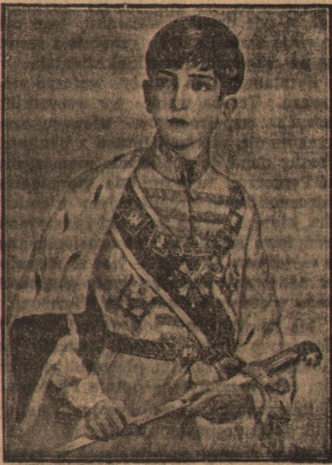
Król Jugosławji Piotr

Pogrzeb króla angielskiego Jerzego V. zgromadzi w Londynie wiele głów koronowanych i książąt z domów królewskich. Przy tej sposobności warto sobie przypomnieć, ile tronów królewskich utrzymało się jeszcze w Europie, w któ-