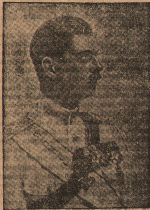
Król Rumunji Karol

Marsylji korona królewska przypadła w udziale młodzikiem księciu Piotrowi. Mały król, który obecnie kształci się w