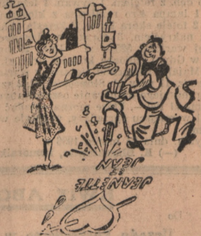
Zabochy w nawiązaniu do jędzn.