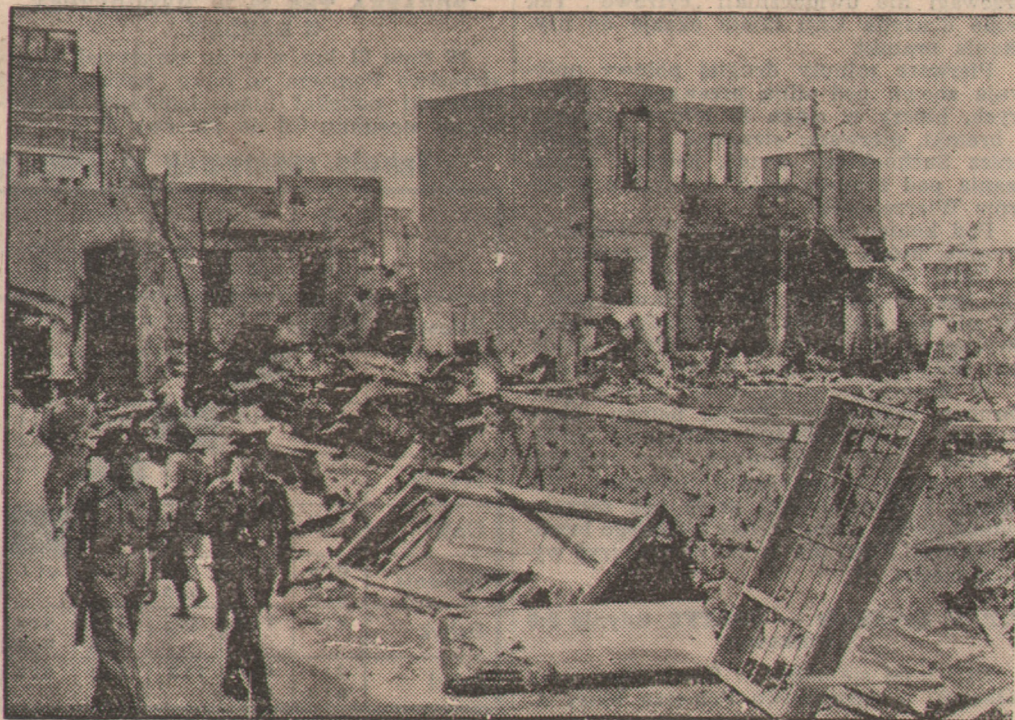
Patrole wojskowe krążą po mieście, strzegąc sklepów i domów żydowskich