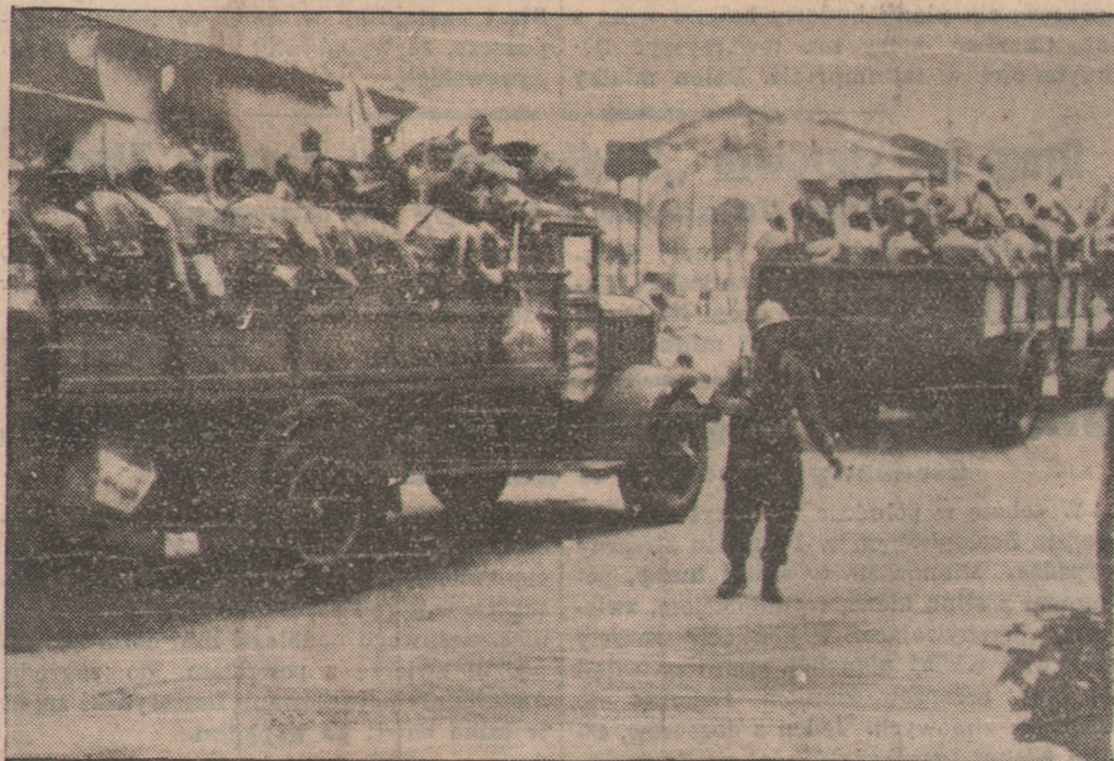
Samochody transportowe wojsk włoskich w drodze do Addis Abeby.