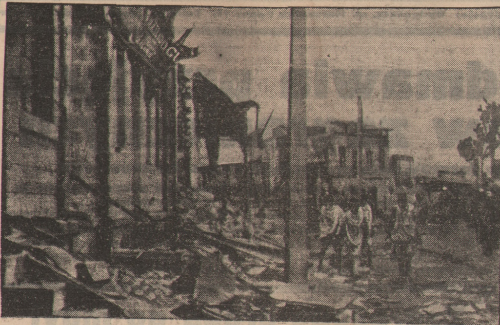
Sklepy i domy stały się pastwą rabujących tłumów