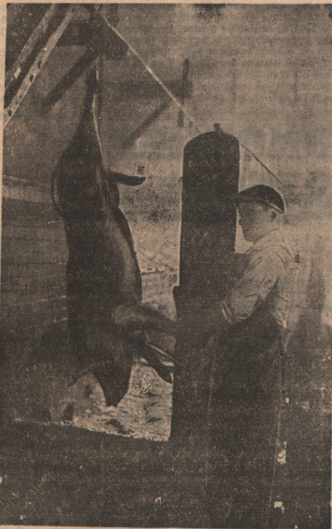
Skrwianie świni bekonowej po wciągnięciu elewatozem na tor bekonowy

go w pierwszym rzędzie i przede wszystkim powinny interesować.