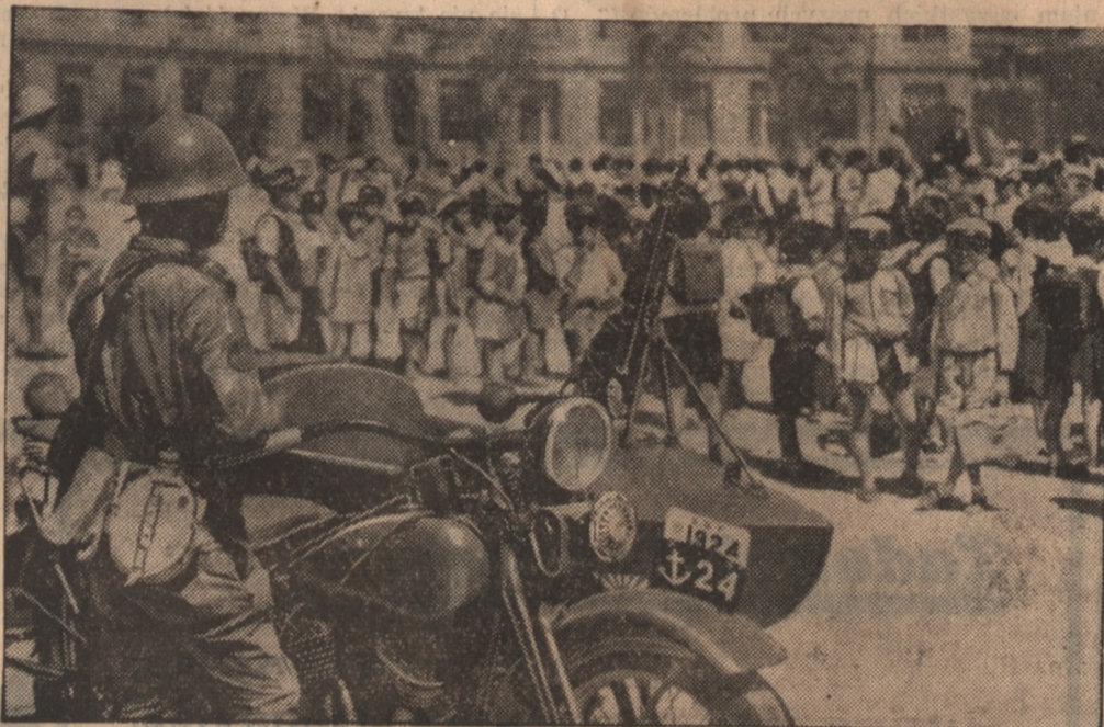
Japońska młodzież szkolna pod opieką armii. — Oto grupa dzieci japońskiej Kolonii w Szanghaju, pod opieką żołnierza-motocyklisty, aby je uchronić od skutków tamtejszych rozruchów.

polityki, a za jedyny środek wzbogacenia się kraju uznano uprzemysłowienie państwa. I odtąd kroczy Japonia wielkimi krokami ku lepszej przyszłości. Nadmiar ludności skierowano ku ziemiom białych, którzy z czasem, w zrozumiałej obawie przed zalewem żółtej rasy, ograniczyli możliwości emigracji japońskiej. Kolonizacja, a następnie po wojnie chińsko-japońskiej, aneksja Formozy i całego szeregu mniejszych wysep archipelagu Riu-Kin, stworzyły tego rodzaju sytuację, że Żółte morze i Chińskie zostały opasane pierścieniem japońskich wpływów. Kolonizacja japońska sięgnęła jeszcze dalej, do Borneo, Nowej Gwinei aż wreszcie wdarła się na kontynent, wywołując