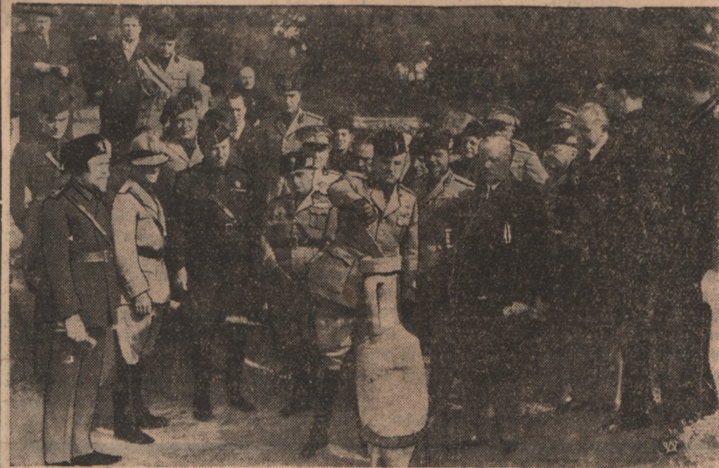
Moment z uroczystości pobrania ziemi z Palatynatu rzymskiego do amfory rzymskiej.

„Tu, gdzie jeszcze bije serce Piłsudskiego, czuwa obecnie wieczyste godło Rzeczypospolitej”.