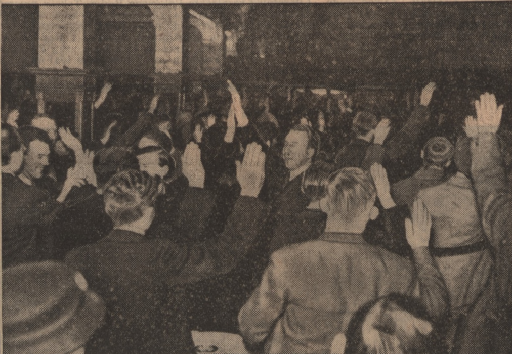
Po rozwiązaniu b. komitantów, którzy przedziflowali przed królem belgijskim, władze policyjne wydały szereg zarządzeń przeciwko rexistom. Oto grupa rexistów opuszczających manifestacyjną zebranie

Resztki potraw, porostające między zębami, muszą być usunięte! Dlatego też wiedziam: Chlorodont