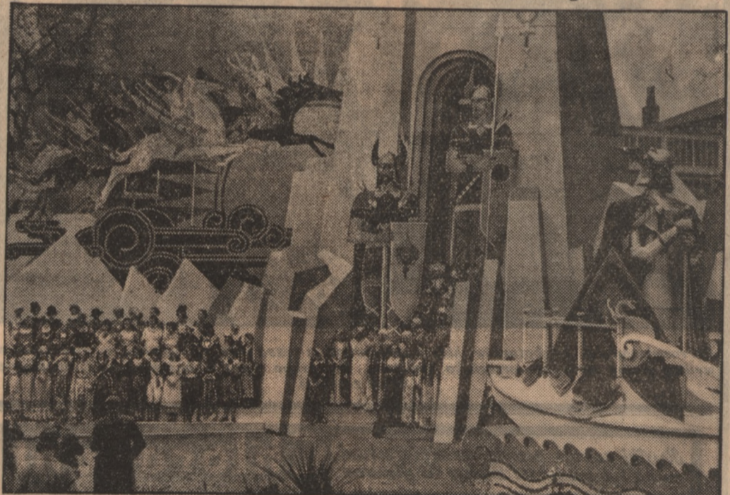
Rokrocznie przeprowadza się w Irlandii na cele społeczne loterię, która dochodzi do rozmiarów święta ludowego. Na zdjęciu grupa młodych dziewcząt w kostiumach na tle dekoracji teatralnych różnych oper.