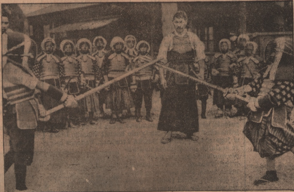
W szkołach japońskich wysuwa się sport na pierwsze miejsce. Oto lekcja walki wręcz, gdzie chłopcy japońscy uczą się fechtunku.