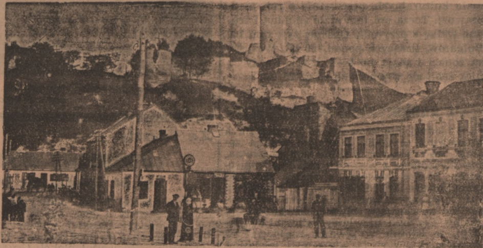
A oto co z niego dziś pozostało

— Jesteś widzę niezdecydowany. Przemawiają przez ciebie skrupuły gorliwego katolika. Rodzina? Chcesz wiedzieć co to jest rodzina, to ci zaraz powiem. Czasy dawne minęły bezpowrotnie. Rodzina w 1934 r. przedstawia się nieco inaczej niż dawniej. Osią, dookoła której obraca się uczucie rodzeństwa jest portfel ojca. Stanowisko w społeczeństwie, posada, stosunki są najgłębszymi źródłami miłości. Znajdź się bez grosza przy duszy, zaraz ci przypiszą wszystkie wady, będziesz niezdolnym, niedołąga życiowym, balastem, wyrzutkiem. Wszystkie progi zamkną się przed tobą. Obawa, że możesz czego żądać, ostudzi twe otoczenie