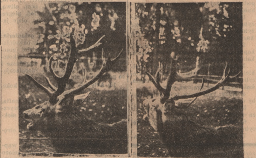
Dwa wspaniałe jelenie ryczą w pobliżu zainstalowanego w lesie mikrofonu Rozgłośni Pomorskiej. Jest to niezwykle ciekawy dokument w związku z nagraniem transmisji p. t.: „Rykwisko jeleni”.