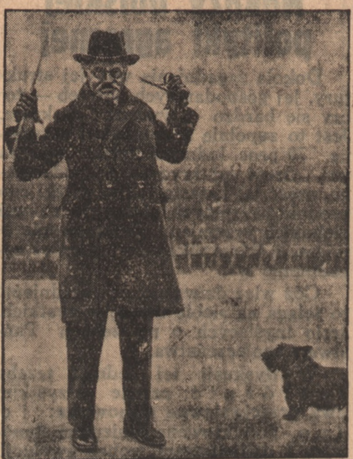
Były premier angielski nie zamierza ćwiczeń cielesnych.