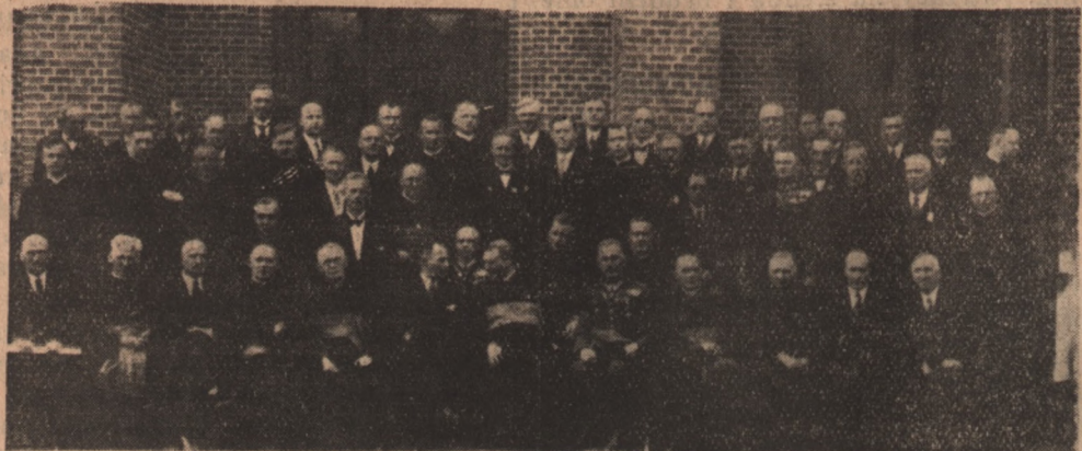
Grupa przedstawicieli władz i duchowieństwa w dniu poświęcenia kościoła św. Józefa na Nowym Mieście w Tczewie.

Na ogół życie handlowe w Tczewie jest dość rozwinięte. Na szczególną uwagę zasługuje handel bławatami. Rzadko spotkać można na Pomorzu miasto,