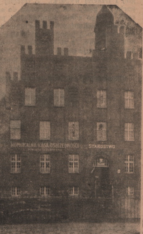
Komunalna Kasa Oszczęd. pow. tczewskiego w gmachu Starostwa Powiatowego w Tczewie

deży ogólny obrót, który w roku 1930 wynosił 8.200.000 zł., a obecnie ten sam obrót roczny wynosi ponad 35.000.000 zł. Również na bardzo wysokim pozio-