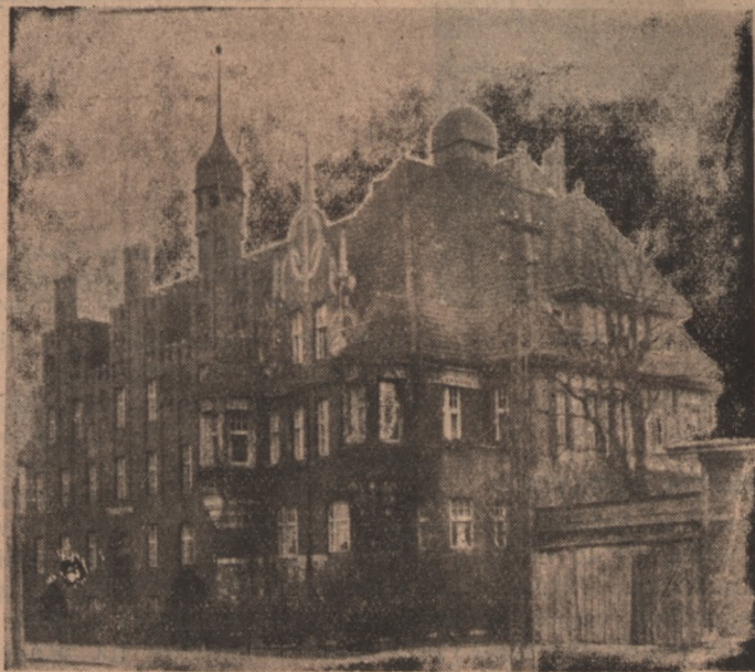
Łamach Starostwa Powiatowego w Tczewie.

w którym była by taka ilość składów tej branży i tak wspaniale urządzonych. Dalej rozwinięty jest dosyć handel to-