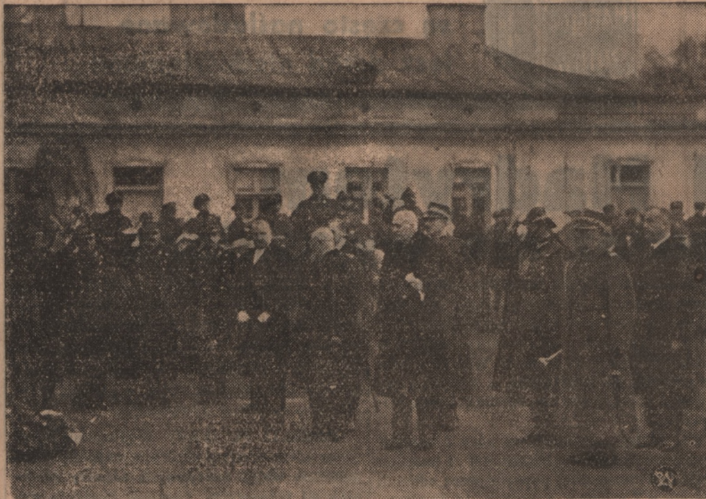
Moment po złożeniu wieńców na stropniach Belwederu przez najwyższych dostojników Państwa z P. Prezydentem R. P. i Naczelnym Wodzem Marszałkiem Śmigłym-Rydzem na czele