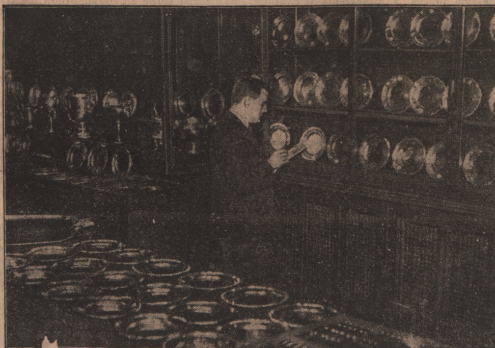
Srebrny skarb Neusa na licytacji

Wyrok: pół roku więzienia z warunkowym zawieszeniem na 5 lat pod rygorem zwrotu pieniędzy w przeciągu 6 miesięcy.