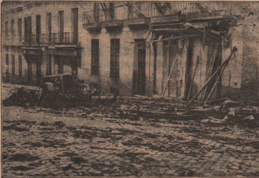
Ślady walk ulicznych w Madrycie.

Z powodu zatopienia statku „Komsomol” prasa sowiecka zamieszcza ostre artykuły, atakując postępowanie okrętów powstańczych hiszpańskich, traktujących je jako akty korsarstwa.