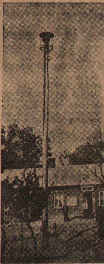
Zdjęcie nasze przedstawia syrenę elektryczną we wsi Komalinie, w powiecie łowickim