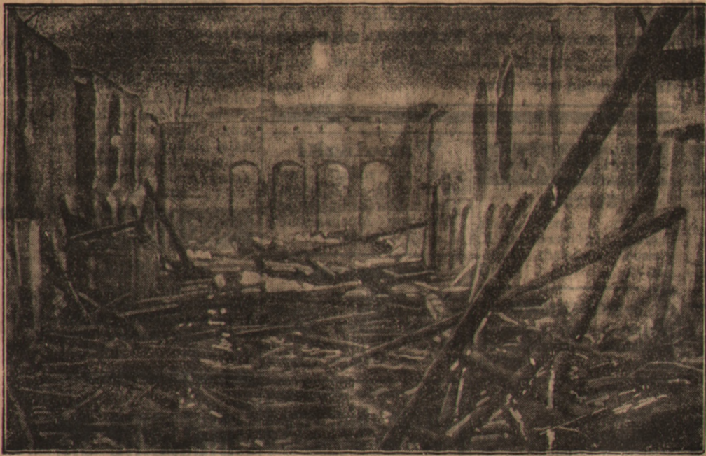
W miejscowości Balie przy ujściu Łaby spłonął podczas świąt Bożego Narodzenia kościół z 13-go stulecia