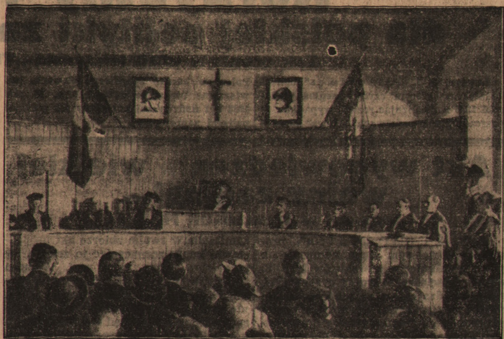
Po wprowadzeniu do Abisynii włoskich sądów odbyło się w Addis Abebie pierwsze posiedzenie nowo utworzonego sądu apelacyjnego