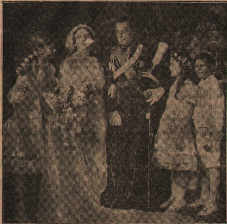
Holenderska następczyni tronu Juliana ze swym małżonkiem księciem Bernardem po ceremonii ślubnej

towarzyszy trzech panów. Przywieźli oni ze sobą 14 kufrów. Z dworca kolejowego dostojni goście przejechali do hotelu „Patria” powozem zakładowym. Apartament, który zajęto, składa się z 2