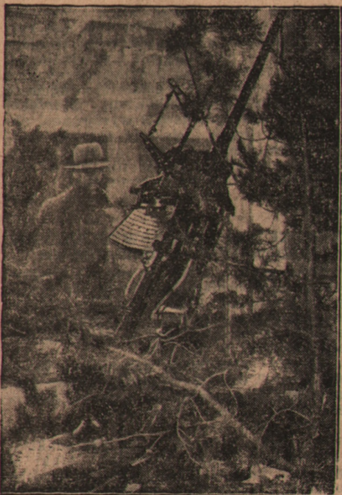
Jedna z fabryk niemieckich wystawiła w oknie wystawowym w Berlinie małe działo przeciwlotnicze.

czym oba rządy informują się wzajemnie o postępach okupacji Maroka przez oddziały niemieckie.