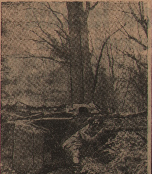
Na fotografii — dwaj żołnierze wojsk powstańczych na pozycji w jednym z parków podmiejskich

cierający powstańcy naprzód usiłowali przerwać linię obrony pod Pozuelo na południe od Haja-Da Honda. Żołnierze rządowi w zacieklach walkach nie cofają się ani o krok. Atak powstańców rozwija się z jednego z punktów odcinka w dwóch kierunkach, zmierzających