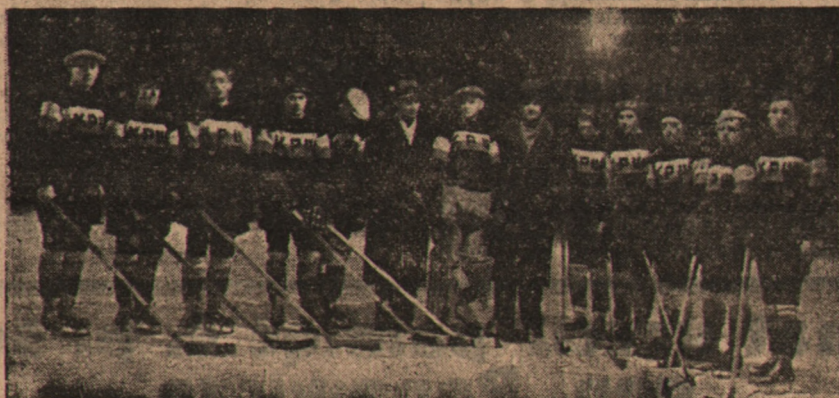
Drużyna KS. KPW. Pomorzanie, która zdobyła wicemistrzostwo Pomorza

Gryf wystąpił w najsilniejszym składzie. Pomorzanie natomiast usunął Kiedrzyński go z obrony wstawiając w jego miejsce Świeca. Obrona Pomorzanie na tym zyskała. Gryf od samego początku rusza w niebywałym tempie do ataku i już w pierwszej minucie po pięknej kombinacji pierwszej trójki ataku zdobywa dla Gryfu prowa-