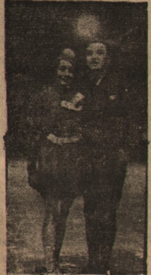
Mistrzowska para Pomorza w jeździe figurowej

Drugi mecz między „Wawelem” i „Legią” zakończył się zwycięstwem „Wawelu” 3:2 (1:2, 2:0, 0:0).