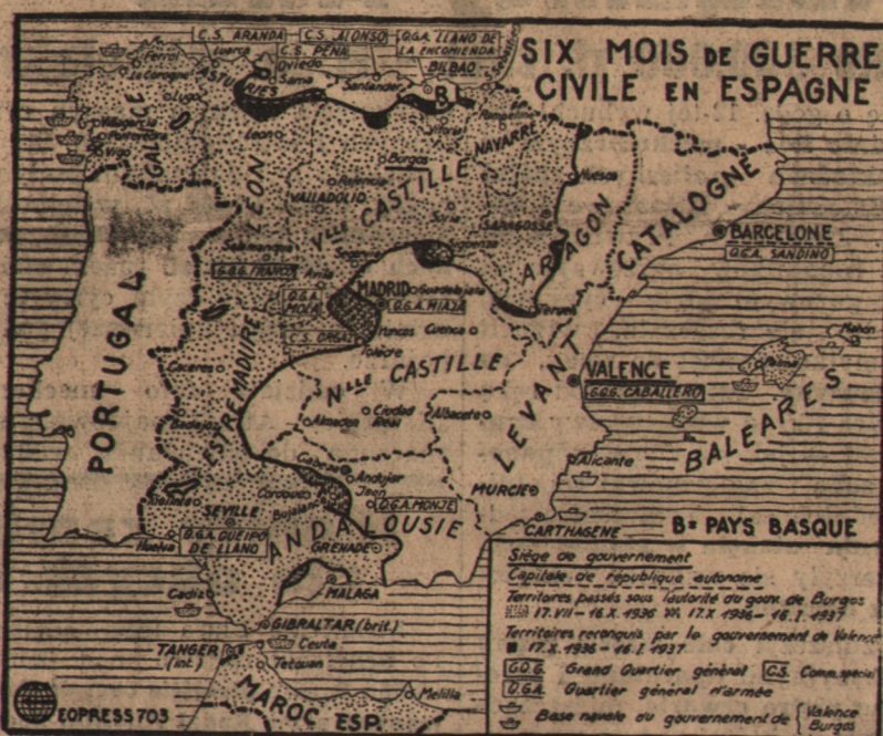
Front hiszpański w dniu 17. 1. br

Scheer” i którego załoga została następnie uwolniona, po przybyciu do Malagi zawiadomił, iż 6 członków załogi nie chciało powrócić na terytorium republiki hiszpańskiej, skierowano ich do Tangeru. „Aragon” — jak