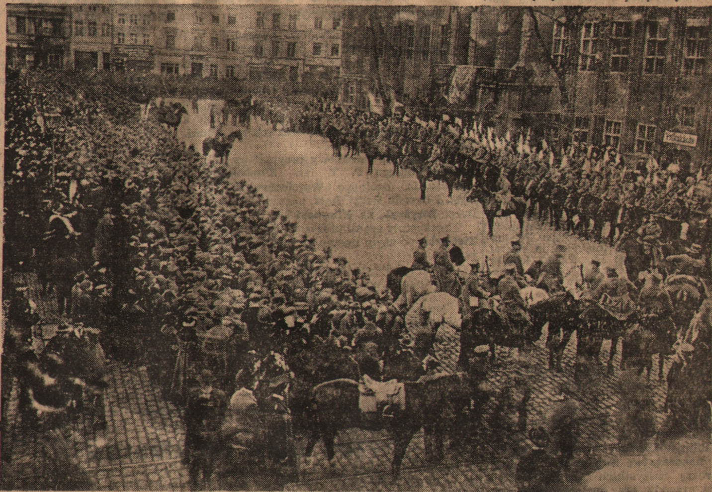
Wojsko Polskie na Rynku Staromiejskim w Toruniu

Akt oskarżenia o zdradę stanu tarannie i szczegółowo opracowany przez prokuraturę, jest dokumentem niezmiernie charakterystycznym. Stwierdza on ponad wszelką wątpliwość na podstawie drobiazgowych danych zebranych przez pruskie władze śledcze, że społeczeństwo polskie rwało się do czynu zbrojnego, do zrzucenia jarzma niewoli i jedynie karne podporządkowanie