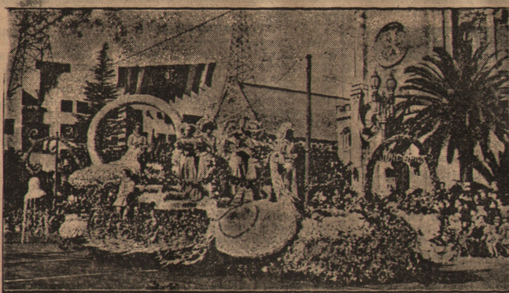
W jednym z kalifornijskich kwiatusk urządzono święto kwiatów n. n. „romans kwiatów“. Tysiące róż przyozdobiono fantastyczne wozy „corsa“