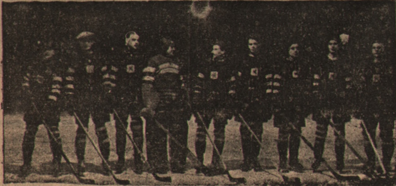
Nowo upieczony mistrz Pomorza WKS „Gryf” Toruń

rozegrany został finałowy mecz o mistrzostwo hokejowe Pomorza pomiędzy miejscowymi klubami Gryfu i Pomorzanie. Mecz zakończył się zwycięstwem Gryfu w stosunku 3:0, poszczególne tercje 1:0 2:0 i 0:0. Sędziował p. Falkowski. Widzów zebrało się około 1000 osób.