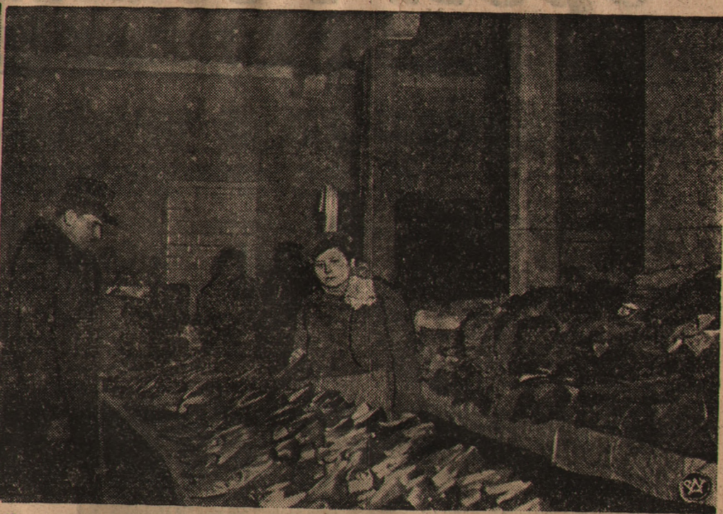
Na zdjęciu widzimy lokal składnicy odzieżowej przy ul. Czerniakowskiej Nr. 131. Na fotografii moment segregacji obuwia dla bezrobotnych. Na stole obok widać zdezynfekowane i przygotowane do rozdania naczki odzieżowe dla bezrobotnych