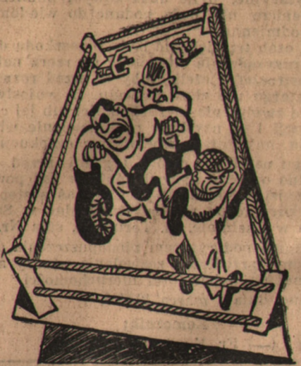
Bokser pod pantoflem.

— Porażkę jeszcze zniosę, ale co mnie w domu czeka!