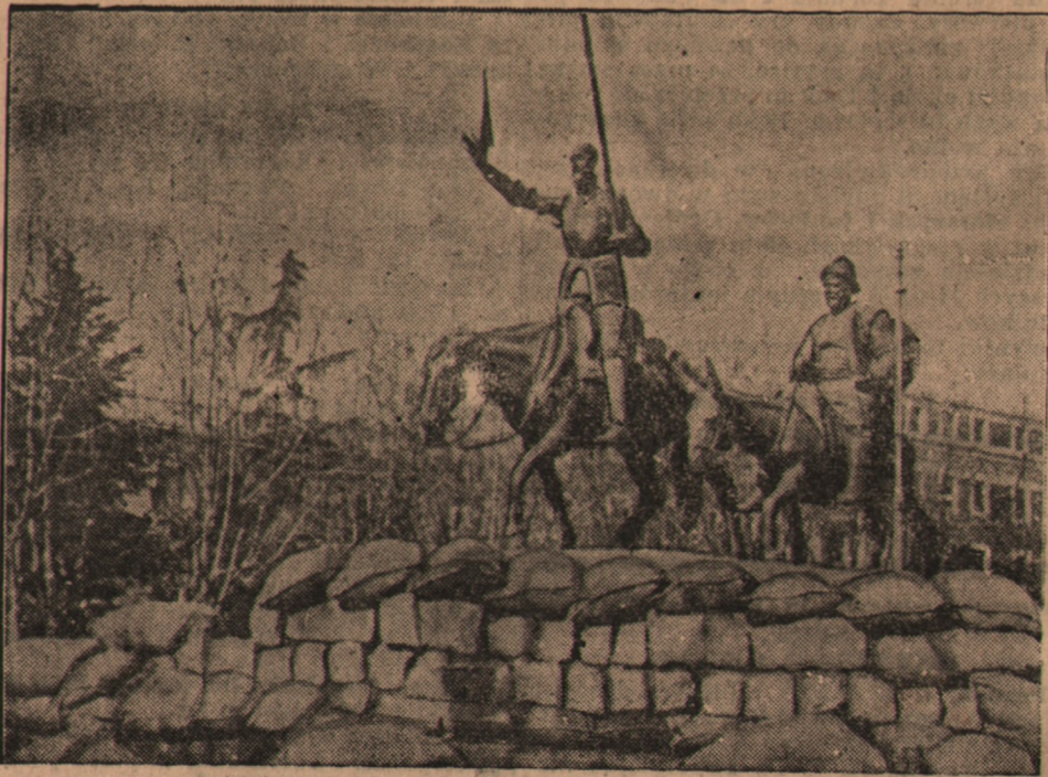
Wojska rządowe wzniosły w Madrycie barykady koło pomnika Don Kiszota