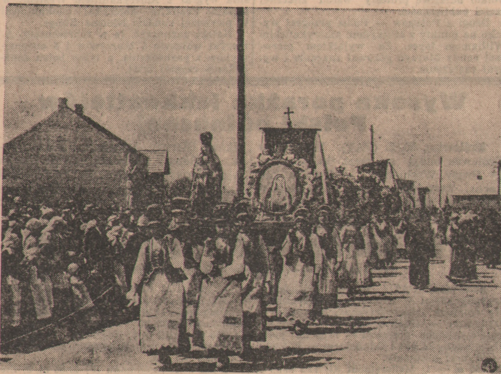
Niezwykle barwnie i strojnie wystąpili Kurpiowie podczas procesji Bożego Ciała. — Oryginalne ludowe stroje kurpiowskie nadały uroczystej procesji, która odbyła się przy pięknej pogodzie, specjalnego uroku, tworząc jedyne w swoim rodzaju, pełne misterium ludowe widowisko. Na zdjęciu naszym fragment procesji Bożego Ciała w Myszyńcu z udziałem tysięcznych rzesz ludu kurpiowskiego.