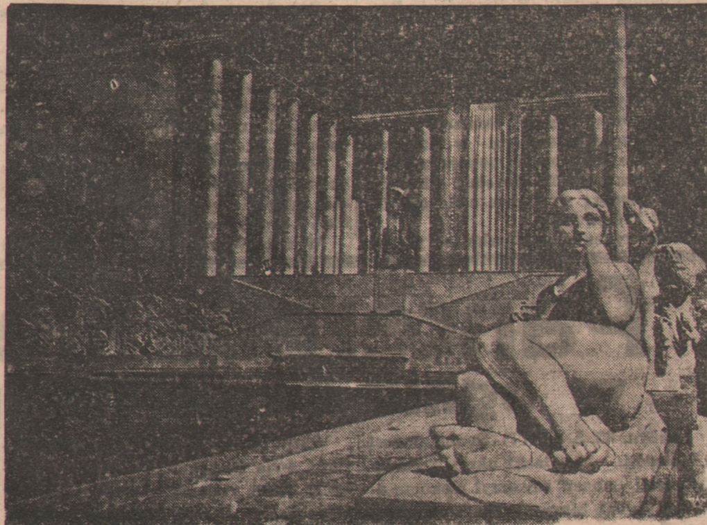
Rzut oka na frontową ścianę pałacu Muzeum Sztuki Nowoczesnej na terenie otwartej przed czterema dniami Międzynarodowej Wystawy Sztuki i Techniki w Paryżu.