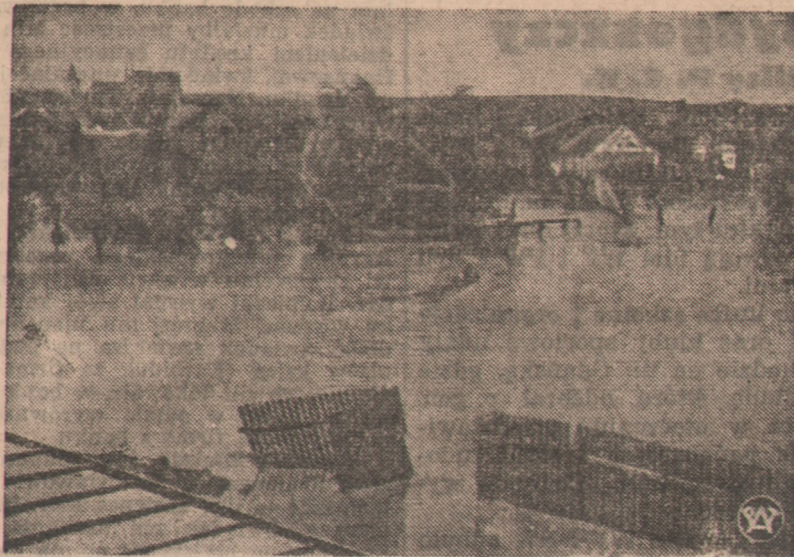
Zalane wodą tereny w Skalmierzu, pow. Pińczów. Okolice te, obok Mlechowca i Działoszyca najbardziej ucierpiały wskutek niespodziewanej klęski strasznego żywiołu.