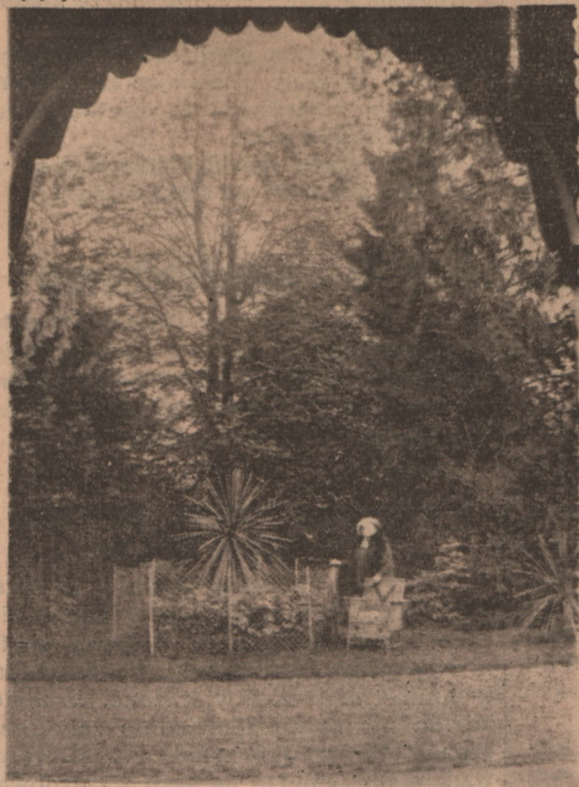
dynie i fragment parku w Piecewie. Dąb, jakich wiele szumiło w dalekim Lu-

wej pracy — w wysokiej kulturze — dobrze i różnorodnie. Z tego względu ma tutaj dominujące stanowisko produkcja roślinna, wyróżniająca się zbiorami. — Silnie zawsze najważniejszą rolę daje w Piecewie nadzwyczajne wyniki w pszenicy i burakach, zajmujących stosunkowo dużą przestrzeń. Ziarno siewne w oryginalnym nasieniu i pierwszych odsiewach dla wszystkich kłosowych — jarych i ozimych.