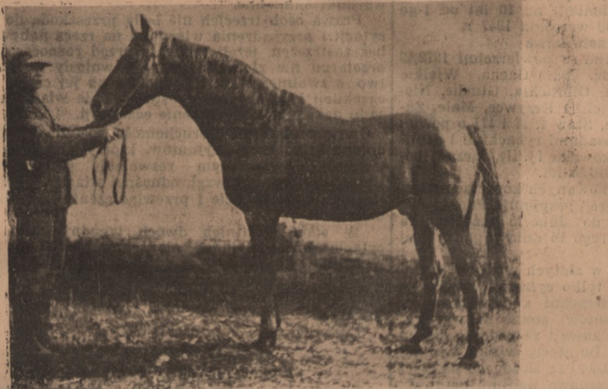
Czołowy reproduktor stadniny piecowskiej Shagia I przechodzący już na „dożywocie”. Do artykułu „Pomorce przed woj. w kulturze rolnej”.