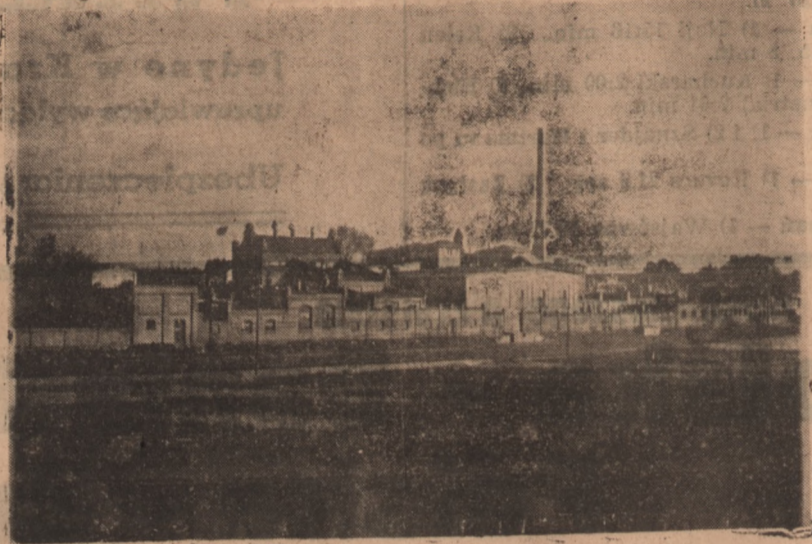
Ogólny widok Rzeźni Miejskiej w Grudziądzu.

Targowisko zaopatrzone jest w wagę pomostową i wszystkie urządzenia, przewidziane najnowszymi rozporządzeniami, tak,