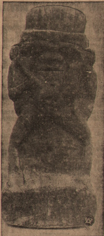
Zdjęcie nasze przedstawia jeden z eksponatów wystawy, a mianowicie figurkę z piaskowca opalonego, wyobrażającą egipskiego bożka dobrych narodzin Bessa, w miejscowości Edfu (z epoki rzymsko-greckiej).