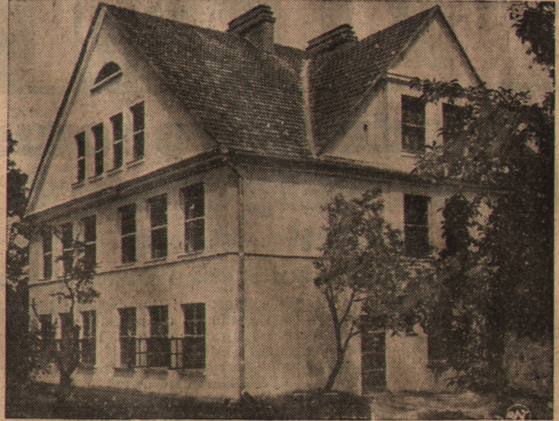
W związku z Tygodniem Propagandowym Budowy Szkół Powszechnych, organizowanym przez Towarzystwo Popierania Budowy Publicznych Szkół Powszechnych, reproduujemy fotografie dwóch szkół powszechnych, wzniesionych przy pomocy Towarzystwa. Zdjęcie 1 przedstawia szkołę powszechną im. Fryderyka Chopina w Chodakowie, pow. sochaczewskiego, zaś zdjęcie 2 — budynek szkoły powszechnej w Wierzbowcu, pow. krzemienieckiego na Wołyniu.