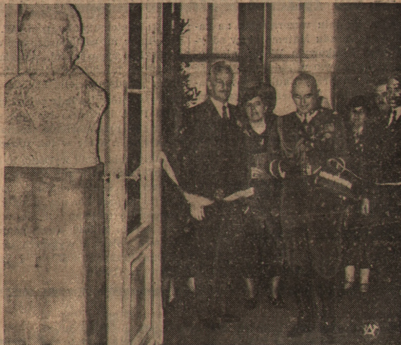
W salonach Resursy Obywatelskiej w Warszawie otwarto wystawę malarstwa, rzeźby i grafiki, zorganizowaną w ramach Powszechnego Festiwalu Sztuki przez działający pod protektoratem Marszałka Śmigłego Rydza Komitet Przyjaciół Sztuki Polskiej. Zdjęcie nasze przedstawia symboliczny moment przecięcia wstęgi przez przybyłego na uroczystość otwarcia wystawy Marszałka Edwarda Śmigłego Rydza.