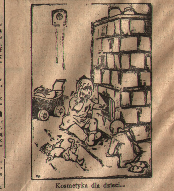
Kosmetyka dla dzieci...