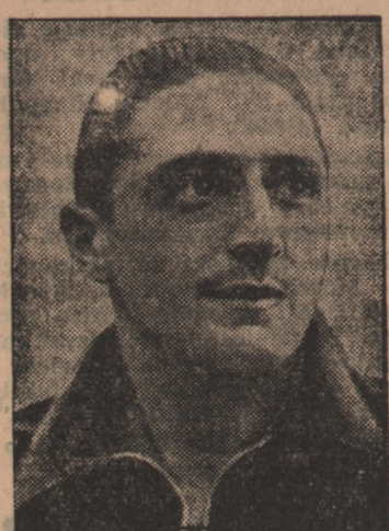
Środkowy napastnik Piola.

Komisja prasy i propagandy rozwinęła szeroką działalność na terenie zagranicznym, skąd stale napływają zapytania do- wodzące wzrastającego zainteresowania zawodami F. I. S.