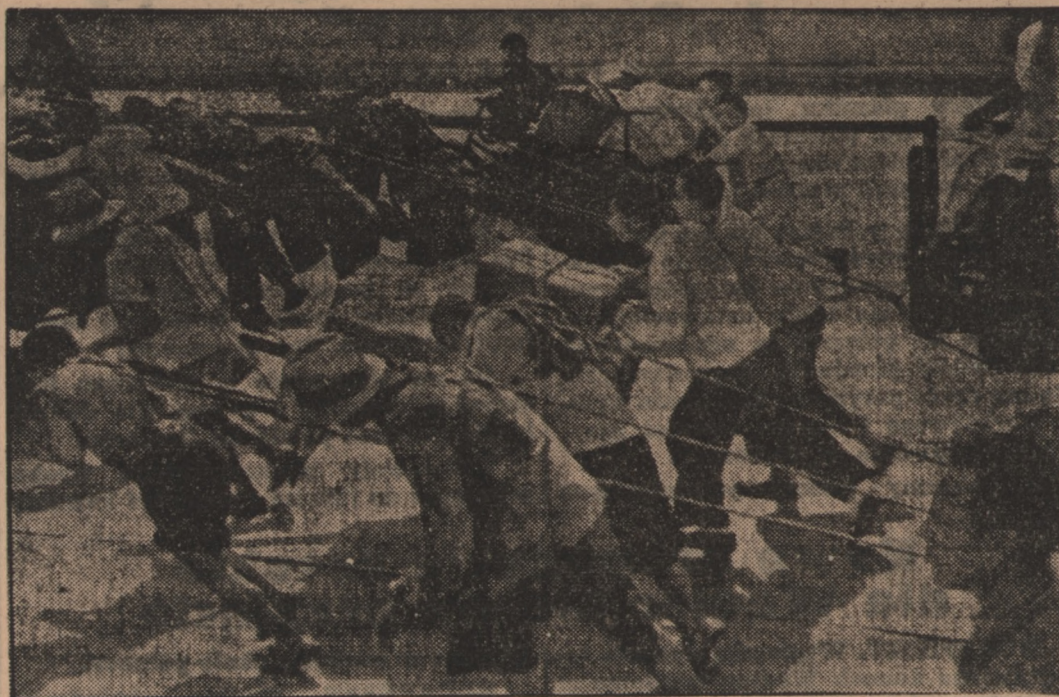
Ludność ożylna Hankau w popłochu opuszcza miasto, uwożąc co tylko można ze swego dobytku

HANKAU. Wobec opuszczenia miasta Hankau przez znaczną część ludności, na ulicach życie prawie całkowicie zamarło. Wszystkie sklepy są zamknięte a ruch uliczny został zredukowany do minimum. Nawet elektrownia przestała działać. Koncesja francuska otrzymuje światło z elektrowni znajdującej się w kon-