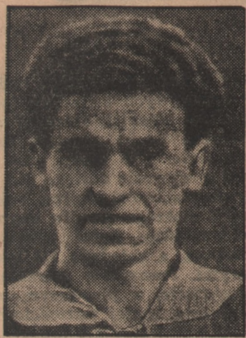
Lewoskrzydłowy Brustad (Norwegia).