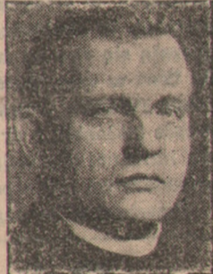
Prezydent Słowacji ks. dr. Tiso

zagranych Polski depeesz, w której zakomunikował, że „zgrupowanie narodowe Słowacji, jedyny oficjalny przedstawiciel Słowaków, na uroczystym posiedzeniu odbytym w dniu 14 marca 1939 r. w Bratysławie proklamowało swą niezawisłość i utworzenie państwa słowackiego w obecnych granicach kraju słowackiego, oraz, że msgr. dr. Józefowi Tiso, prezesowi rady ministrów, powierzono pełnienie funkcji głowy państwa.