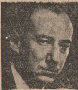
Min. Spraw Zagr. J. Beck

WARSZAWA. Słowacki minister spr. zagr. wystosował do ministra spraw