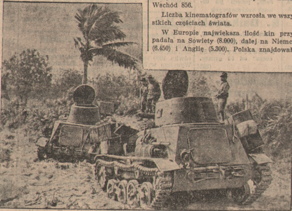
Czołgi japońskie na chińskiej wyspie Hainan.

Po zajęciu portów Morza Żółtego władze japońskie wydały ostrą walkę piratom. Królowa piratów rozwiązała bandę i sama osiadła w Kantonie. Przypadek chciał, że na ulicy poznał ją pewien kupiec, który przed laty padł ofiarą piratki. Piękna awanturnicę, która przez tyle lat była postrachem wód chińskich, czeka obecnie wyrok śmierci.