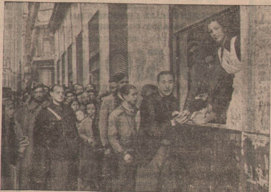
Oto obrazek z codziennego życia w Madrycie — stacja żywnościowa, zaopatrująca mieszkańców w chleb.