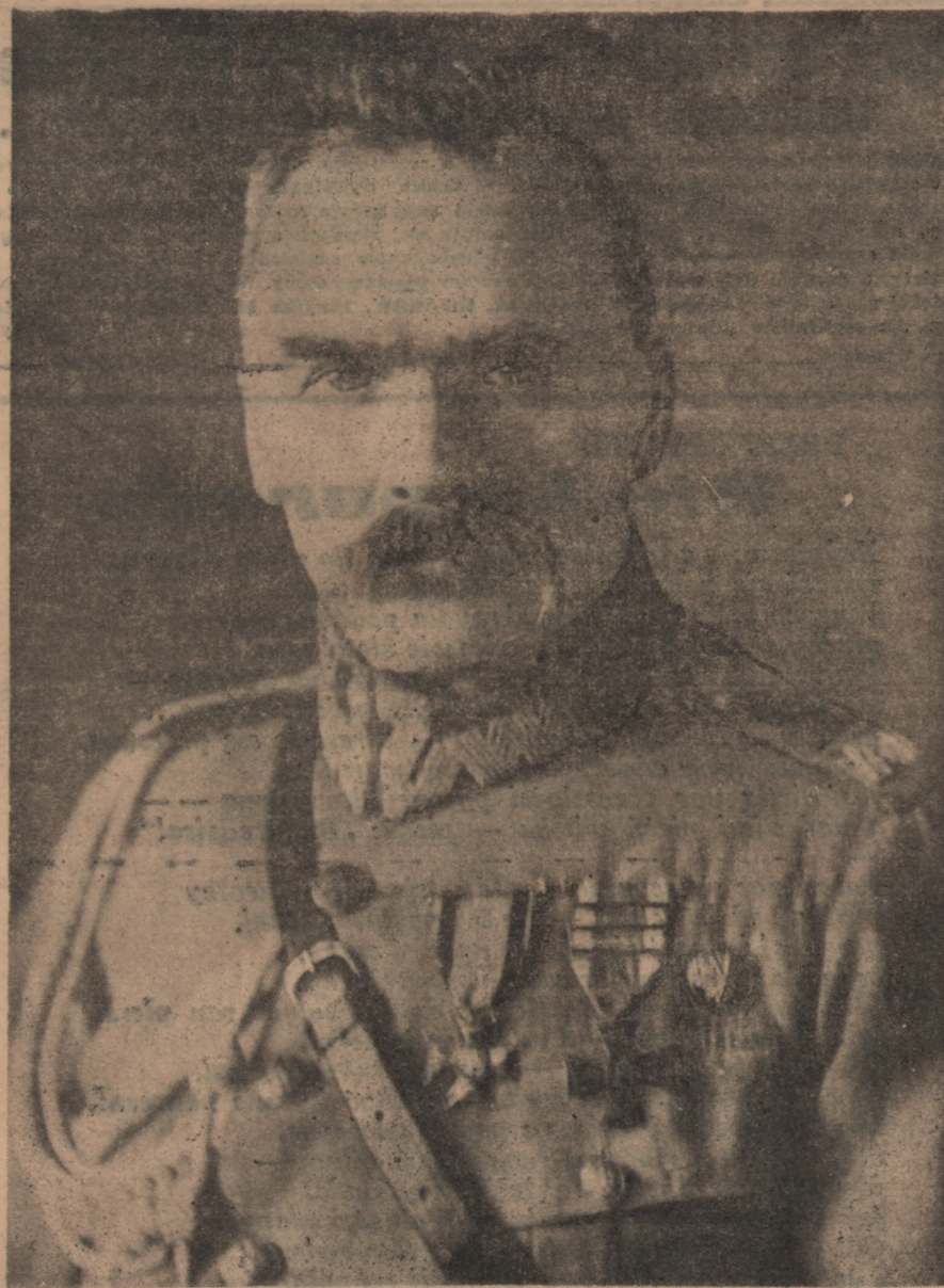
Józef Piłsudski mówi:

Wybiła godzina rozstrzygająca! Polska przestała być niewolnicą i sama chce stanowić o swoim losie, sama chce budować swą przyszłość, rzucając na szalę wypadków własną siłę orężną. Kadry armii polskiej wkroczyły na ziemię Królestwa Polskiego, zajmują ją na rzecz jej właściwego, istotnego, jedyne gospodarza — Ludu Polskiego, który ją swą krwawicą użyźnił i wzbogacił. Zajmując ją w imieniu Władzy Naczelnej Rządu Narodowego, niesiemy całemu narodowi rozkucie kajdan, poszczególnym zaś jego warstwom warunki normalnego rozwoju.