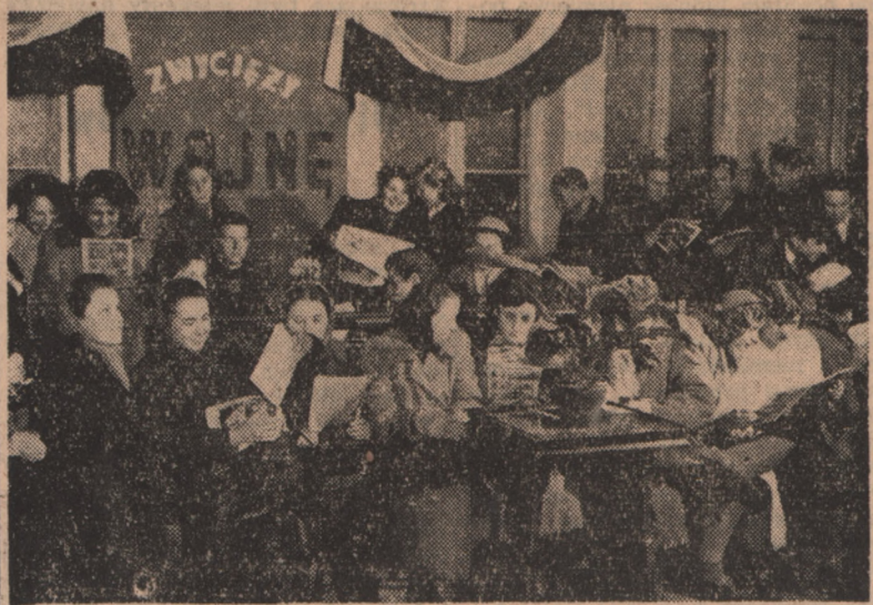
W ramach zobowiązań, podjętych przez pracownice kolejowe z okazji I Ogólnopolskiego Kongresu Ligi Kobiect, otwarto w dworcach warszawskich 4 świetlice, które cieszą się dużą frekwencją podróżnych.

Ukonstytuowanie się prezydium nastąpi w najbliższym czasie.