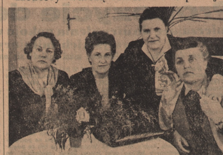
Pozdrawiamy Czytelników IKP