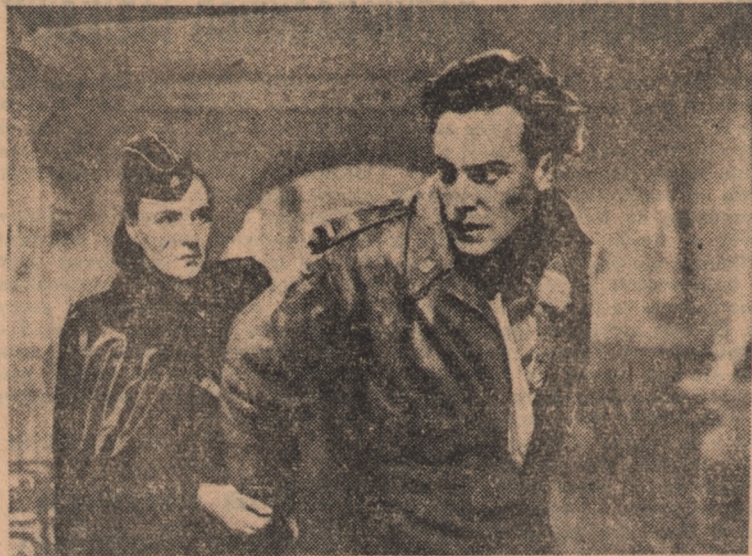
Scena z filmu „Tajna misja”

W jednej ze scen filmu Churchill, dla zadokumentowania swej „wierości” wypowiada następujące słowa: „Jestem gotów ponieść każdą ośmiertelność, aby Ameryka mogła zająć się unicestwieniem bolszewickiej Rosji...”