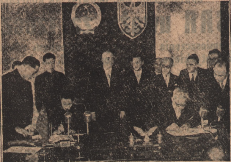
Jak już informowaliśmy w dniu 3 kwietnia br. w gmachu Prezydium Rady Ministrów w Warszawie przedstawiciele Rządu RP i Chińskiej Republiki Ludowej podpisali umowę o wymianie kulturalnej między obu narodami. Z ramienia Rządu Polskiego umowę podpisał minister spraw zagranicznych Stanisław Skrzyszewski, a ze strony Centralnego Rządu Chińskiej Republiki Ludowej ambasador Peń Ming-Chih. Na zdjęciu moment podpisywania umowy.