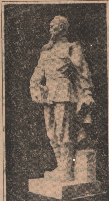
Ministerstwo Kultury i Sztuki ogłosiło ostatnio wyniki konkursu na projekt pomnika Wielkiego Rewolucjonisty Feliksa Dzierżyńskiego. Na zdjęciu projekt rzeźbiarza Dunajewskiego, odznaczony pierwszą nagrodą.

Wydobywając 666-ton węgla ponad plan, wzmocnił front obrońców pokoju, przyspieszamy budowę socjalizmu w Polsce.