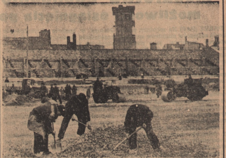
W berlińskim Lustgardenie, który z okazji tegorocznego międzynarodowego Święta Pracy zostanie przemianowany na Plac Marksa i Engelsa, są prowadzone intensywne przygotowania do obchodu pierwszomajowego.