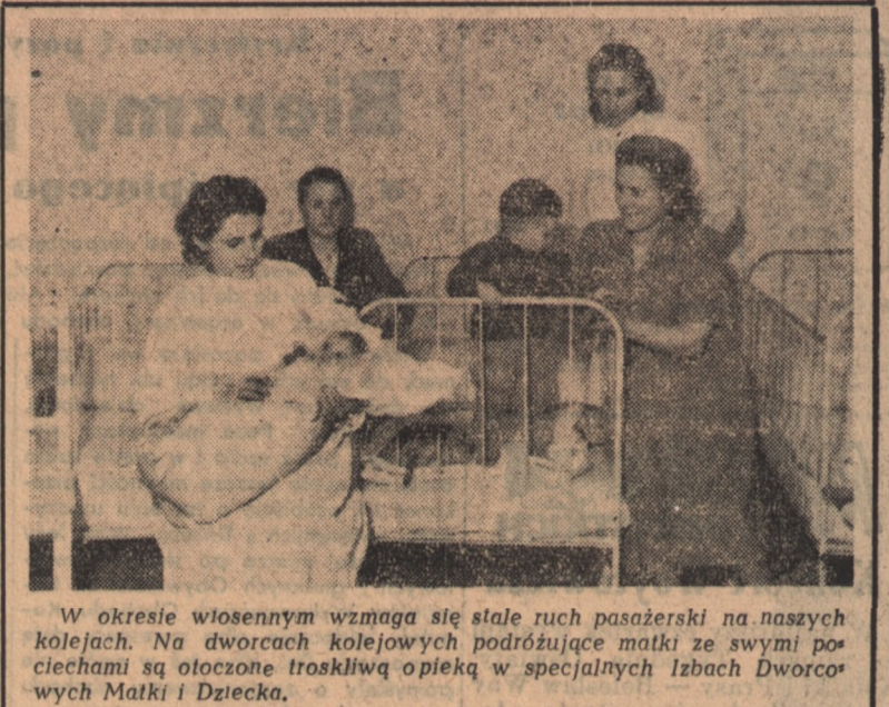
W okresie wiosennym wzrasta stale ruch pasażerski na naszych kolejach. Na dworcach kolejowych podróżujące matki ze swoimi pociechami są otoczone troskliwą opieką w specjalnych Izbach Dworcowych Matki i Dziecka.

I chociaż powiedzenie, że przyjdzie czas, gdy wina polskie nie będą ustępowały winom węgierskim, czy włoskim wydać się dziś może grubą przesadą — przesadą jednak nie jest. Jest pewnikiem, który zostanie zrealizowany w niedalekiej przyszłości. JOT