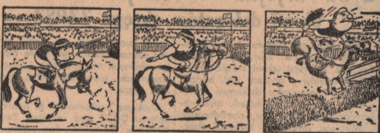
Rysunek bez podpisu (Szabad Szał, Budapest)

OGŁOSZENIA drobne po 150 zł za słowo. Minimalna opłata za 10 słów. Maksymalna ilość 30 słów. Ogłoszenia millimetr: w tekście 10 80 zł za tekstem 4 50 zł nekrologi 3,— zł za 1 mm. Ogłoszenia w specjalnej rubryce 30,— zł za 1 wiersz 3-lamowy (za tekstem). W niedziele i święta 50% drożej. Za terminowe zamieszczenie ogłoszeń nie odpowiadamy — Konto PKO IKP nr VI-140