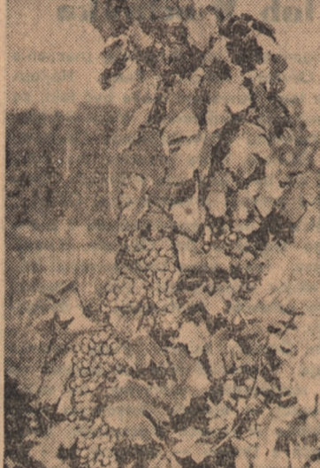
Największa w Polsce kruszwicka wytwórnia win w Planie 6-letnim produkować będzie również wina gronowe.

Farbę rozpuszcza się przez naciągnięcie na sito szmatkę, następnie wrzuca się do roztworu kawałki materiału i podczas gotowania stale się obraca, żeby materiał ufarbował się równomiernie. Do obracania materiału najlepiej posłużyć się pałyczkami. Dokładne wskazówki dot. farbowania podaliśmy w poprzednim „Kąciku Kobięcym”.