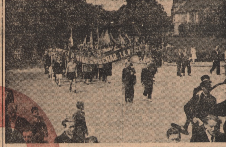
Kierownik biegu Urbański wraz z sędzią lekkoatletycznym Downarowiczem zbliżają się na czele pochodu 800 zawodników do miejsca startu Vj biegu o puchar IKP.