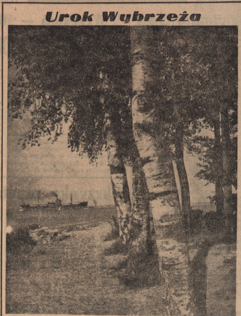
Nad Bałtykiem rozpoczęły się wczasy pracownicze. Nieperona jeszcze pogoda nie potrafiła odstraszyć wczasowiczów od spędzenia tam urlopu już nawet w maju. Gdy jednak słońce znacznie przygrzewać mocniej — wybrzeże, a szczególnie miejscowości nadmorskie Pomorza Zachodniego zaroją się tysiącami rzeszami wczasowiczów. Na zdjęciu: uroczy zakątek wybrzeża w pobliżu Ustki.