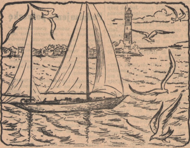
Z obu stron rozciąga się morze. Z jednej strony spokojne, zmarszczone lekką morską wodą zatoki, z drugiej ożywiony Bałtyk...