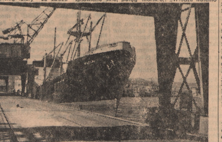
Coraz to nowe statki pod polską banderą wykazują, że jesteśmy narodem morskim.

ce i parki miejskie, które w naj-bliższych latach zostaną trzy-krotnie powiększone. Miasto nad Łyną przykłada bowiem dużo u-wagi do spraw swych zielonych „pluc“. Uporządkowana zostanie dzie-ki pomocy młodzieży SP część parku leśnego w pobliżu miasta. Nowy okazały zieleńiec powsta-nie nad Łyną w okolicy zamku. Sprawi to, iż cała okolica aż do mostu kolejowego stanie się uroczym zakątkiem wypoczynko-wym. Drugi nowy zieleńiec pro-jektuje się w Alei Wojska Pol-skiego przed Wojewódzkim Do-mem Kultury. Sa to tylko fragmenty budow-nictwa Olsztyna, o których sły-szy i które dostrzega przybysz bez wszechstronnej informac-ji. A jednak świadcza one o tym, że w wiekowym mieście tętni nowe, socjalistyczne ży-cie. (ju-k)