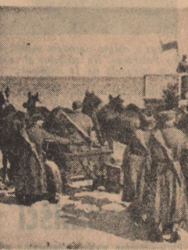
Zołnierze I Armii Wojska Polskiego nad odzyskanym Wybrzeżem Bałtyku pod Kolobrzegiem.