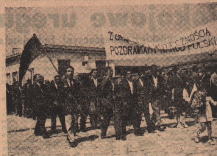
Jak już donosiliśmy, do Warszawy przybyła 56-osobowa grupa hiszpańskich patriotów, bojowników o wyzwolenie Hiszpanii spod jarzma faszystowskiego reżimu Franco. Na zdjęciu: Fragment powitania na Dworcu Głównym w Warszawie.