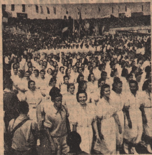
Podczas uroczystości otwarcia III Światowego Zlotu Młodych Bojowników o Pokój odbyła się w Berlinie wielka defilada sportowców, manifestujących na rzecz utrwalenia pokoju. Na zdjęciu fragment defilady: maszeruje młodzież radziecka, rozbudzając swoją postawą entuzjazm publiczności, która do ostatniego miejsca wypełniła nowo wybudowany stadion.