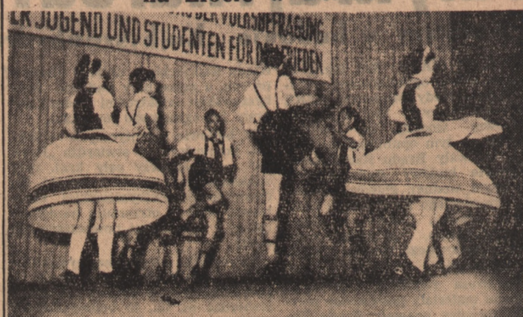
U góry: Zespół niemiecki w tańcu bawarskim. Obok: Scena z tańca z bębnami w wykonaniu młodzieży Chin Ludowych.