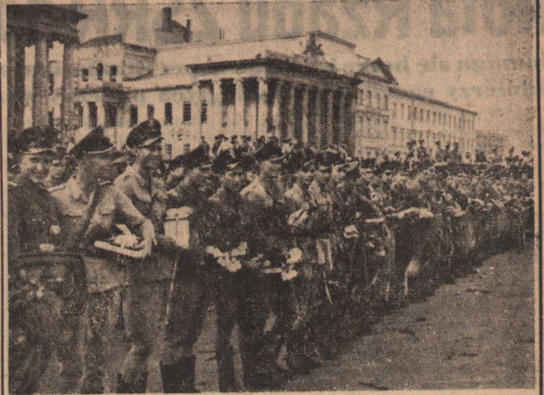
Dnia 30 września br. ludność stolicy powitała powracające z ćwiczeń letnich jednostki wojskowe garnizonu warszawskiego.

Na placu Dzierżyńskiego przodującym żołnierzom zostały wręczone upominki od społeczeństwa warszawskiego oraz od kół Związku Młodzieży Polskiej.