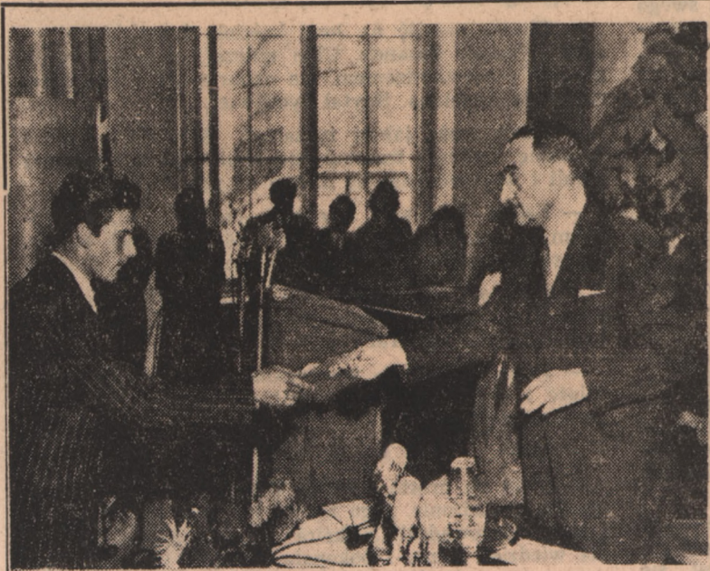
Z inauguracji roku akademickiego w Warszawie. Na zdjęciu: Fragment uroczystości na Uniwersytecie Warszawskim. Moment symbolicznej immatrykulacji.

Jak wiadomo, dnia 4 bm. mija ostateczny termin, wyznaczony przez rząd irański specjalistom angielskim na opuszczenie granic Iranu.