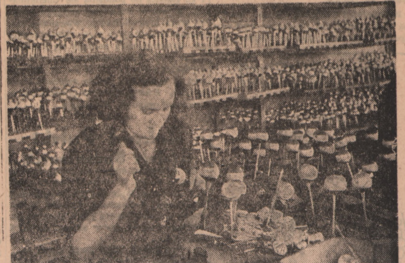
Malowanie ozdób, to delikatna i dokładna robota. Ale zrecznie malarzykańcają ich dziennie po kilkadziesiąt.