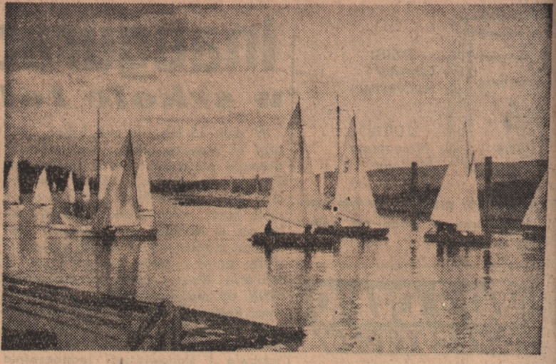
Korzystając z pięknych dni jesieni, wodniacy w całej pełni zajmują rozkoszy na rzekach i jeziorach polskich. Ostatnio na wodach Wisły i Brdy odbył się wielki ogólnopolski wyścig żaglówek z Torunia do Bydgoszczy.

— Większy ode mnie na pewno nie jesteś, ale chyba chciałś powiedzieć, że jesteś dłuższy — zażartował Napoleon.