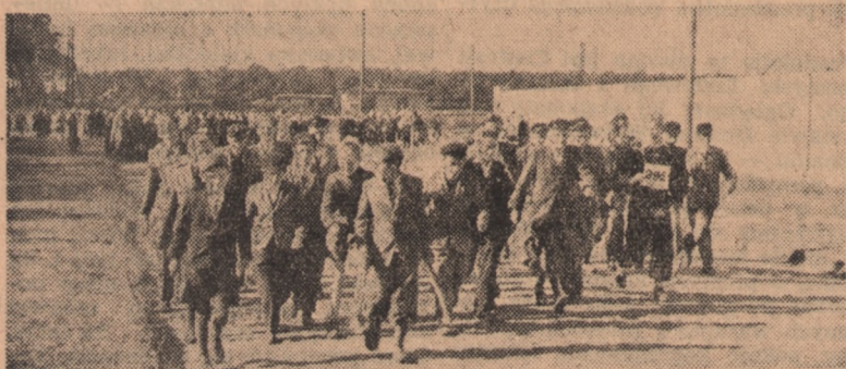
I najmłodszy stanął na starcie. Dziarskie miny i sprężysty krok — to podstawy przyszłych sław sportowych.

Liczny udział, wspaniała postawa maszerujących były dowodem rozwoju kultury fizycznej i wzrostu sił obronnych Polski Ludowej.