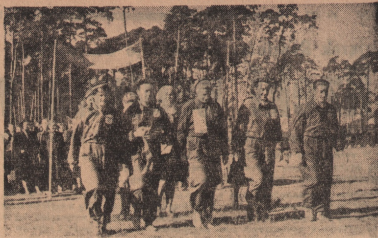
Ubiegła niedziela stała w całym kraju pod znakiem marszów „Szlakami Zwycięstw”. Maszerowali wszyscy: mężczyźni i kobiety, żołnierze i młodzież szkolna. Oto grupa dziewcząt w radosnym marszu.