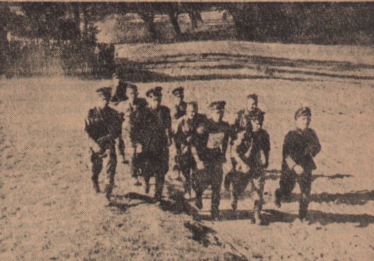
Dla zaokumentowania historycznych zwycięstw I Armii walczącej u boku bohaterkiej Armii Radzieckiej odbywają się corocznie masowe marsze „Szlakami Zwycięstw”.

W ubiegłą niedzielę setki tysięcy sportowców, młodzieży szkolnej i żołnierzy manifestowało na trasach serdeczną więź, łączącą naród z Ludowym Wojskiem Polskim, manifestowało uczucia głębokiej przyjaźni do narodów Związku Radzieckiego.