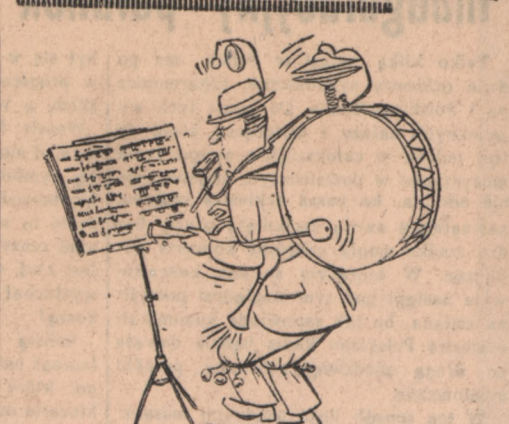
Rysunek bez podpisu („Die Woche”, Wiedert)

REDAKCJA I ADMINISTRACJA W BYDGOSZCZY ul. Czerwonej Armii 20. — Telefon nr 33-41 i 33-42. DZIAŁ OGŁOSZEŃ W BYDGOSZCZY ul. Generalissimusa Stalina 2 (Pod Arkadami). Tel. 24-29. Prenumerata: pocztowa 3,60 zł. przez roznościela 3,90 zł miesięcznie. Rekopisów niezamówionych Redakcja nie zwraca. — Za ogłoszenia Redakcja nie odpowiada. PRENUMERATE ZLECONĄ PRZYJMUJĄ DO 15 KAŻDEGO MIESIĄCA WSZYTKIE URZĘDY I AGENCJE POCZTOWE ORAZ LISTONOSZE. PRENUMERATE POD OPASKĄ WPLACĄ NA KONTO PKO nr VI-1861. REDAGUJE: KOMITET REDAKCYJNY. — WYDAWCA: SPÓŁDZ. WYDAWNICZA „PRASA DEMOKRATYCZNA — NOWA EPOKA”, WARSZAWA, ŚNIADECKICH 16. Oddział w Bydgoszczy, ul. Czerwonej Armii 20, tel. 33-41 i 33-42. OGŁOSZENIA drobne po 1,50 zł za słowo. Minimalna opłata za 10 słów. Maksymalna ilość 30 słów. Ogłoszenia milimetr.: w tekście 10,80 zł, za tekstem 4,50 zł, nekrologi 3,— zł, za 1 mm. Ogłoszenia w specjalnej rubryce 30,— zł za 1 wiersz 2-lamowy (za tekstem). W niedzielę i święta 50% drożej. Za terminowe zamieszczenie ogłoszeń nie odpowiadamy. — Konto PKO „IKP” nr VI-140.