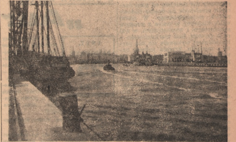
Tallin — port

Po wielkich zniszczeniach, jakich dokonał faszystowski najeźdźca w Estonii w czasie ostatniej wojny — Estońska Socjalistyczna Republika Radziecka już w r. 1948 doprowadziła poziom swej produkcji do stanu przedwojennego, a obecnie przekroczyła go wielokrotnie. Pracują pełną parą także olbrzymie zakłady, jak Krenholmiska Manufaktura, Bałtycka Manufaktura i zakłady „Volta”, 56 stacji maszynowo-traktorowych pozwoliło w bardzo poważnym stopniu zmechanizować prace na roli.