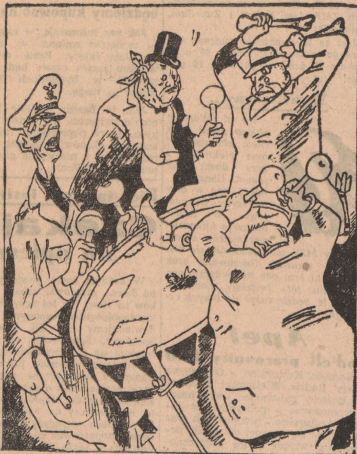
Oto bęben, w który biją od 1918 r. Komentator „Krokodyla”... I od tego roku biją też bębniściw.