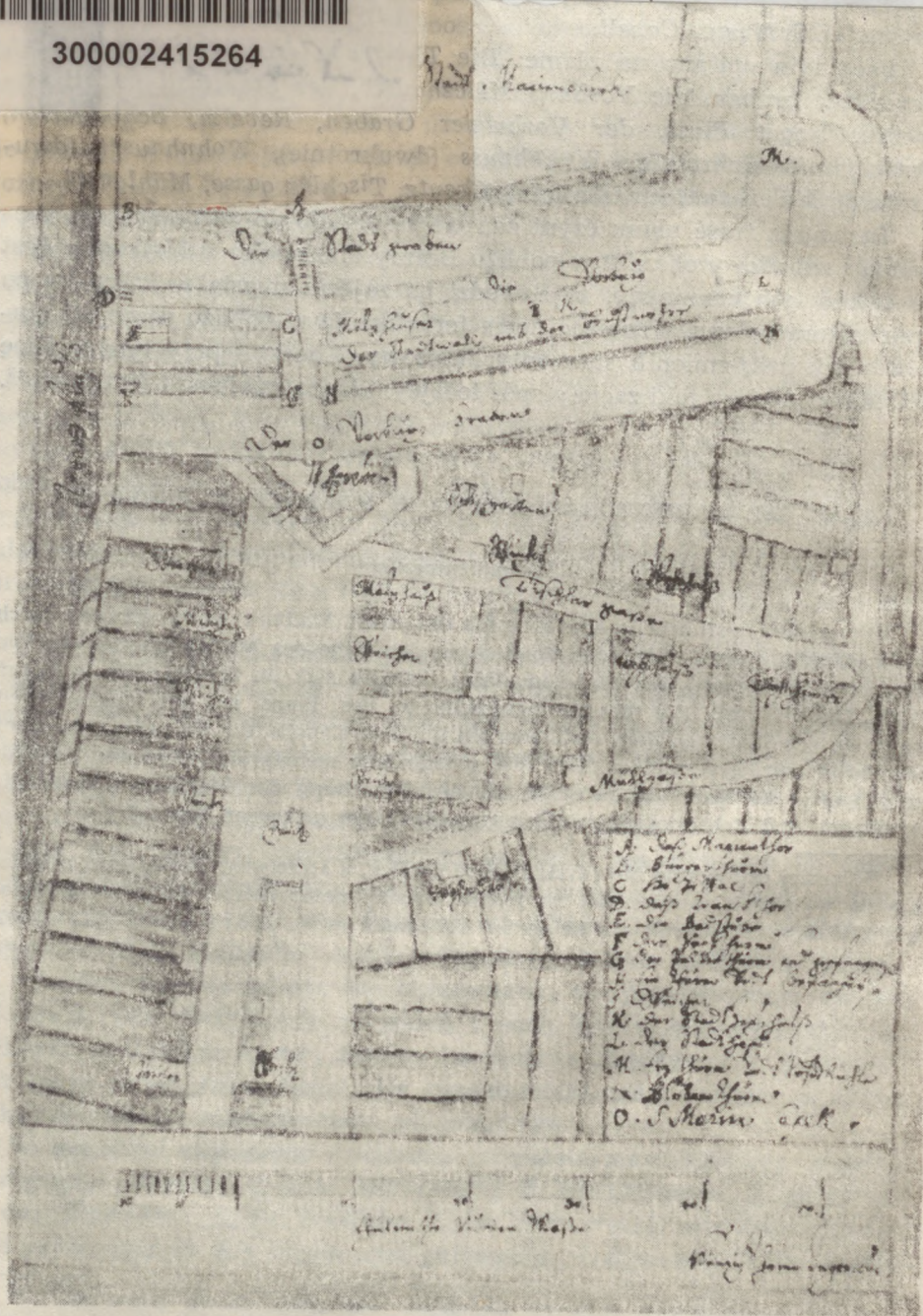
Plan okolicy Bramy Mariackiej w Malborku z 1850 r.