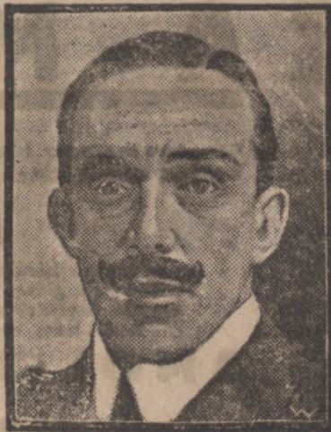
Alfons XIII. król hiszpański.

GARWOLIN. (Pożar strawił 33 zagród włościańskich). Kilkanaście dni temu blisko wieczora wybuchł we wsi Puznówka, gminy Pazysów powiatu garwolińskiego, z niewiadomych dotychczas przyczyn pożar w zabudowaniach gospodarskich Władysława Packa, który w mgnieniu oka objął wszystkie zabudowania położone nieopodal. Na wszczęty alarm cała ludność Późnówka jako też i wsi okolicznych pośpieszyła na ratunek. Brak jednak