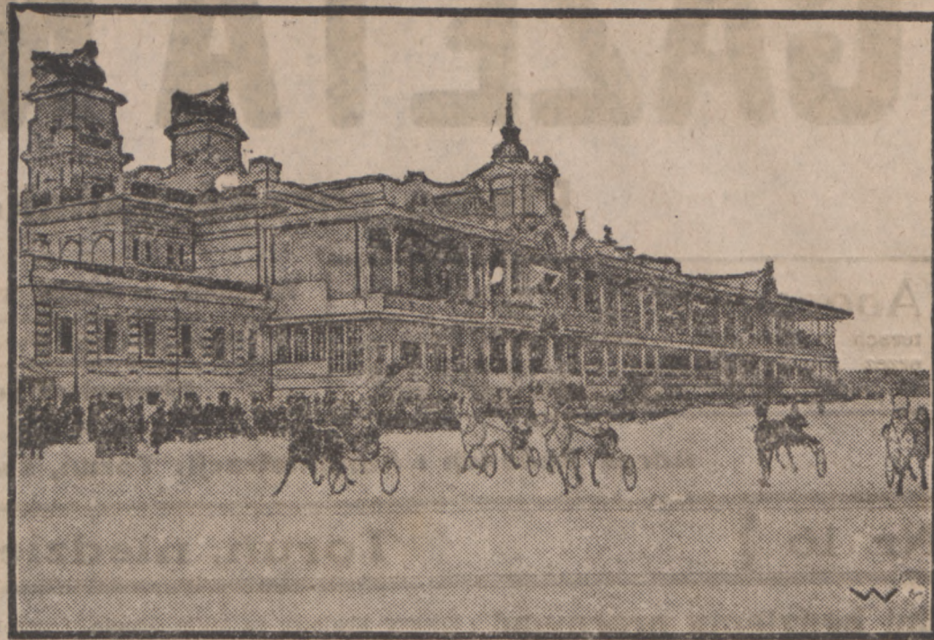
SPORT W BOLSZEWJI.

Projekt przyjął z dawnego projektu większości narodowej zasadę, że do przeprowadzenia parcelacji powołany jest w pierwszym rzędzie sam właściciel majątku oraz przedsiębiorstwa i instytucje posiadające specjalne upoważnienia do prowadzenia parcelacji. Postanowienie to jednak straciło wiele na swej wartości, wskutek zbyt szerokiego zakresu jakie projekt przyznaje ministrowi reform rolnych, tak co do dowolnego zwolnienia pewnych obszarów na pewien określony czas lub pod specjalnymi warunkami, jak i co do przepisów wykonawczych które mają dopiero zawrzeć postanowienia o postępowaniu przy udzielaniu zezwoleń na parcelację, przy zatwierdzeniu planu parcelacyjnego oraz o nadzorze nad parcelacją.