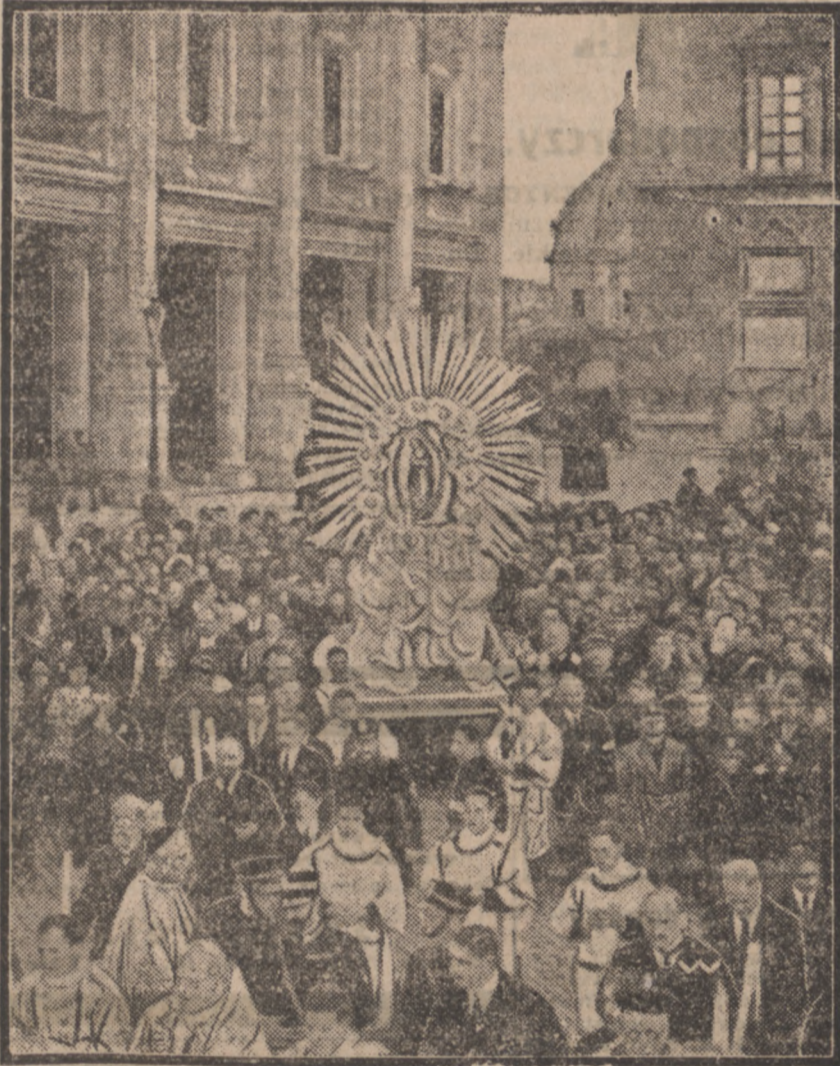
Koronacja obrazu Matki Boskiej z Guadelupy.

Kardynał Mery del Val dokonał koronacji cudownego obrazu Matki Boskiej z Guadelupy. Rycina nasza przedstawia procesję na Piazza del del Campodoglio.