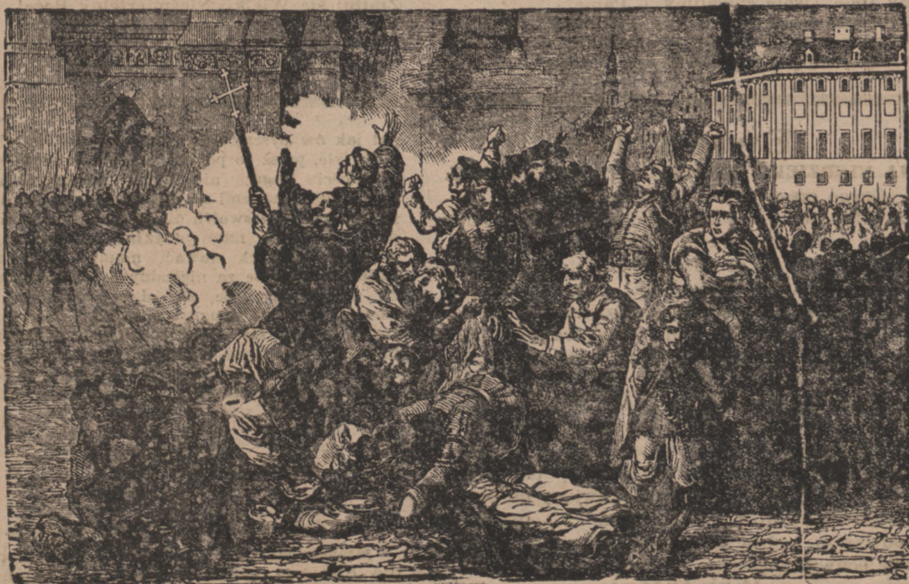
Dzień 8 kwietnia 1864 r. w Warszawie.

Męski czyn iść do stawy przez ogień kartaczy, Lecz uciec od rozkoszy większe męstwo znaczy. Antoni Górecki.