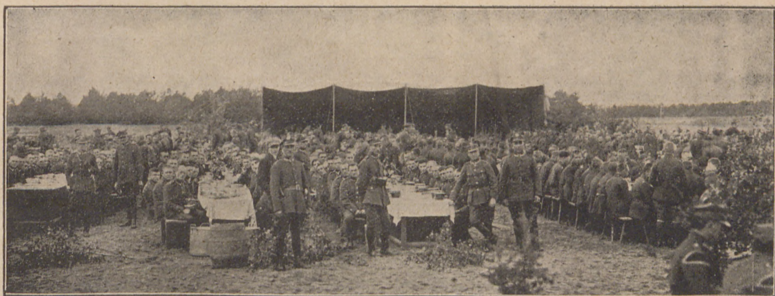
Obiad żołnierski w dniu święta pułkowego 64. p. p.