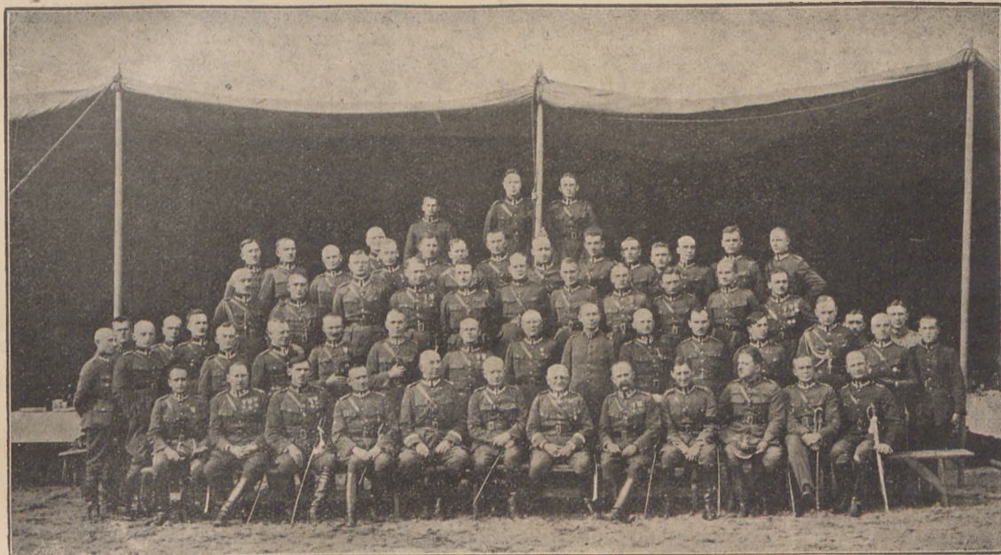
Korpus oficerski 64. p. p. wraz z zaproszonymi gośćmi w dniu święta pułkowego.