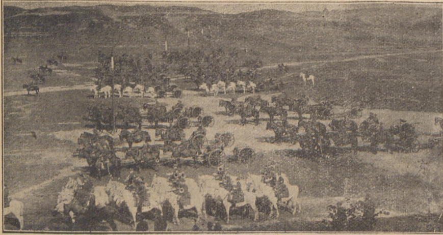
Ustawienie pułku do mszy połowej.