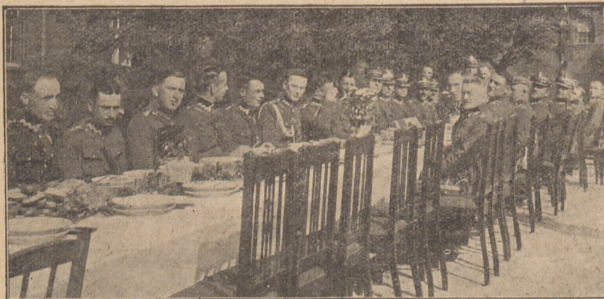
Stół oficerski przy obiedzie żołnierskim.