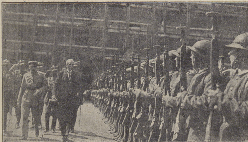
Prezydent Mościcki podczas przeglądu kompanji honorowej.