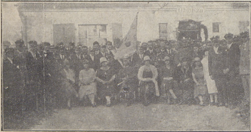
Uczestnicy uroczystości poświęcenia sztandaru w dniu 13. czerwca br. W pośrodku nowoposwiecony sztandar.