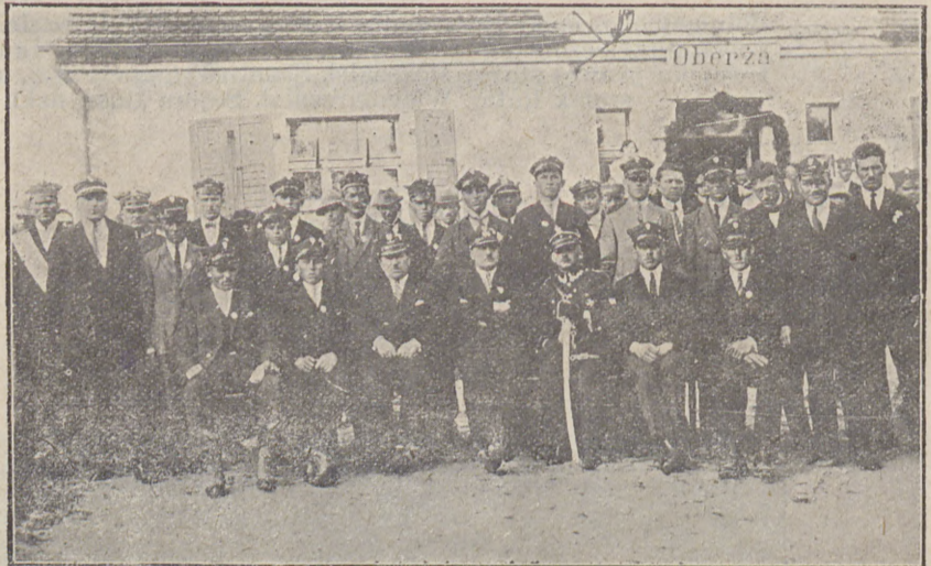
Delegacje Towarzystw Powstańców i Wojaków.