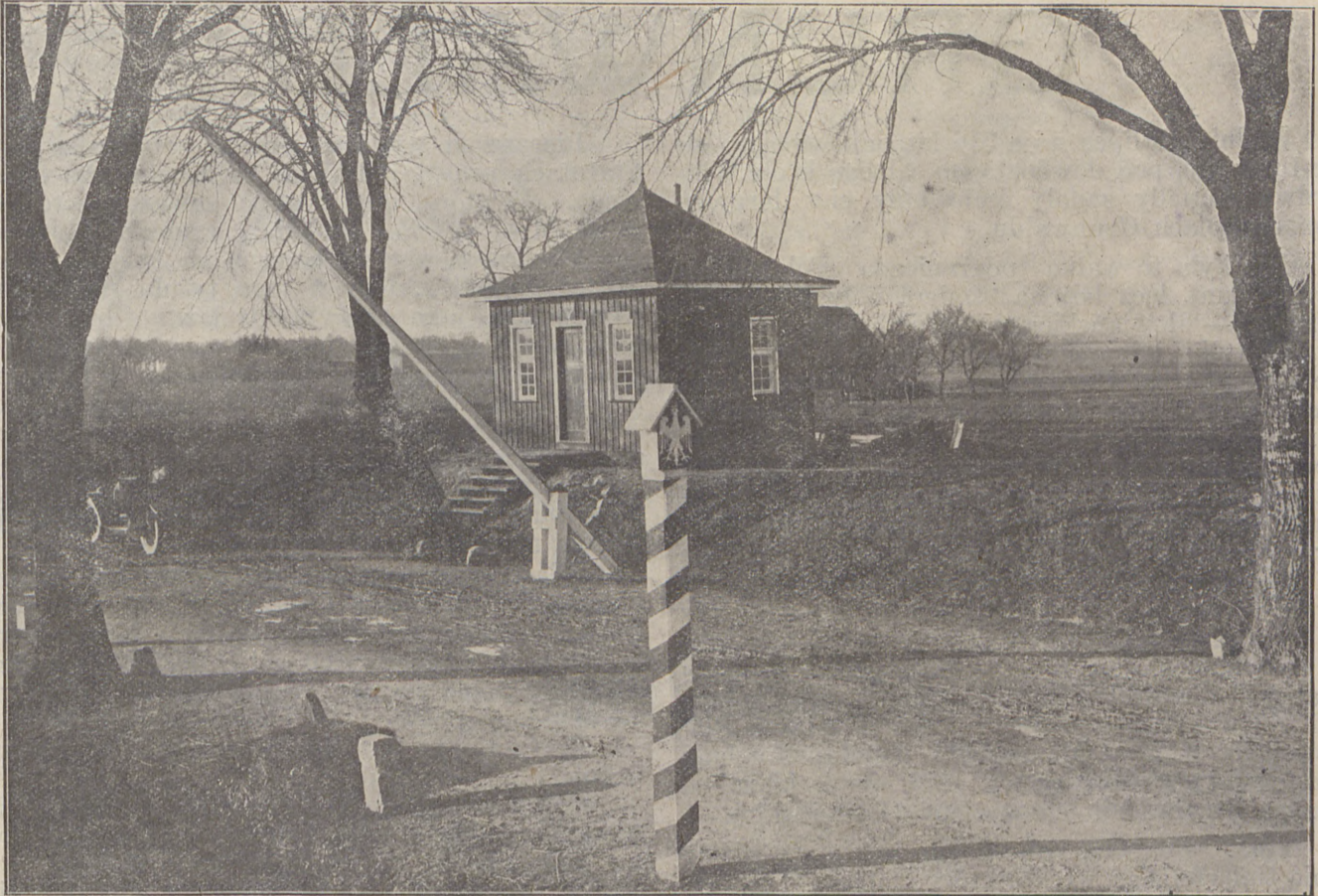
Domek służby granicznej w Gardeji, pow. grudziądzki, postawiony kosztem Wydziału Powiatowego, a służący jako kancelarję dla Posterunku Policji Państwowej oraz Urzędu Celnego. Podobny domek znajduje się również na granicy państwowej w Zawdzie pow. gru- dziądzki, także kosztem Wydziału Powiatowego postawiony.