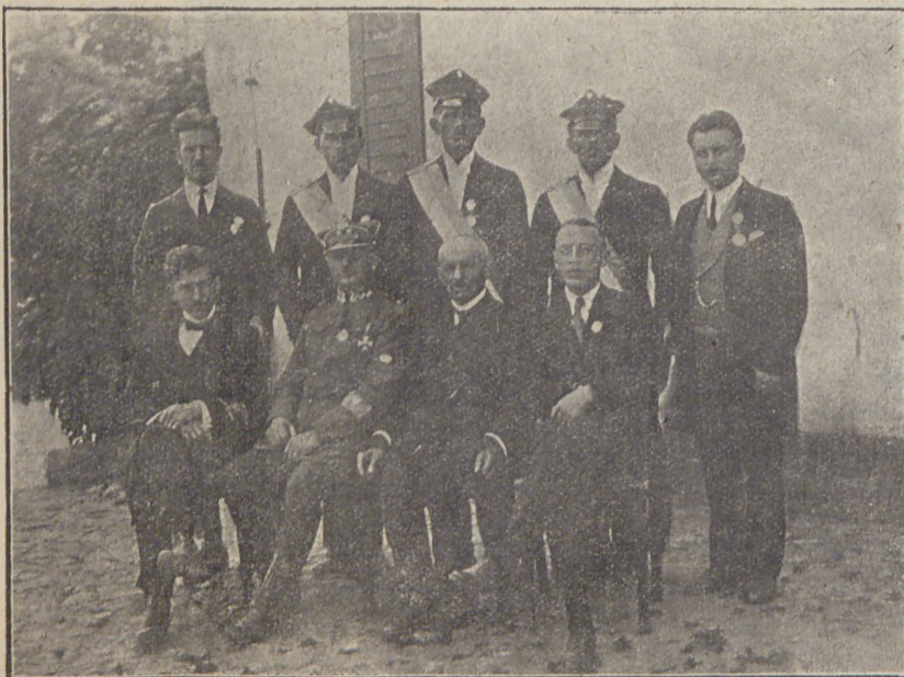
Zarząd Towarzystwa Powst. i Wojaków w Robakowie.