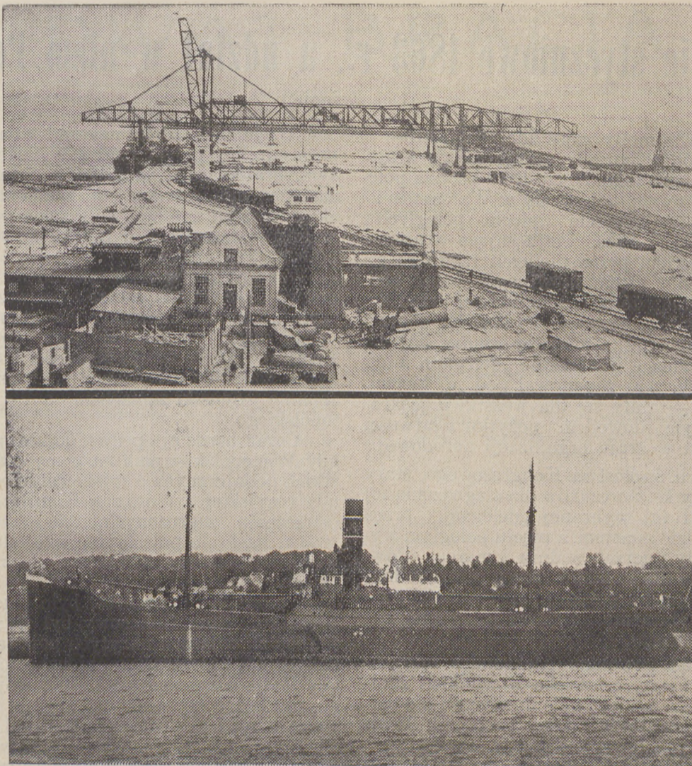
Port w Gdyni. Budowa portu w Gdyni, wprawdzie dość powoli, lecz stale postępuje naprzód. Na górnym obrazku widzimy olbrzymi dźwig, przy pomocy którego przeładowuje się węgiel z wagonów na statki. Na dolnym obrazku widzimy statek francuski, czekający na węgiel.