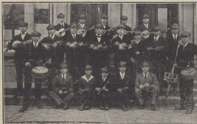
Orkiestra Stow. Młodzieży Polskiej w Nowemmieście n/Drw.