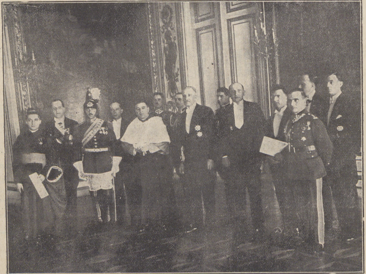
Prezydent Rzeczypospolitej ze swoim otoczeniem po przyjęciu raportu, złożonego przez delegata papieskiego i kapitana gwardji papieskiej.