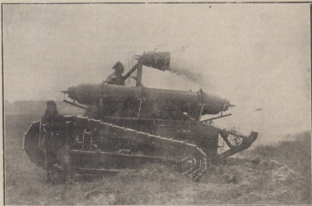
Potwór wojenny. Ostatni typ tanku (czołgu) gazowego, który w przyszłej wojnie ponieść ma w szeregi nieprzyjacielskie śmierć w postaci zabójczego gazu.