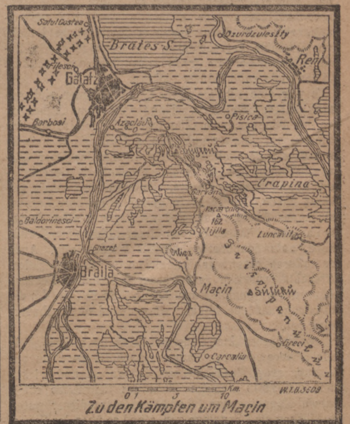
Zu den Kämpfen um Macin

inspirierte Vernichtungsurteil der „Daily Mail“ über Sarrail wieder und fragt, wie es komme, daß 200 000 Bulgaren genügten, um eine halbe Million Entente-truppen im Schach zu halten. Es wäre besser, das Saloniki-Heer für eine bevorstehende große Offensive im Westen zu verwenden, zumal der für die Verproviantierung nötige Frachtraum besser für die Versorgung der notleidenden Ententevölker dienen würde.