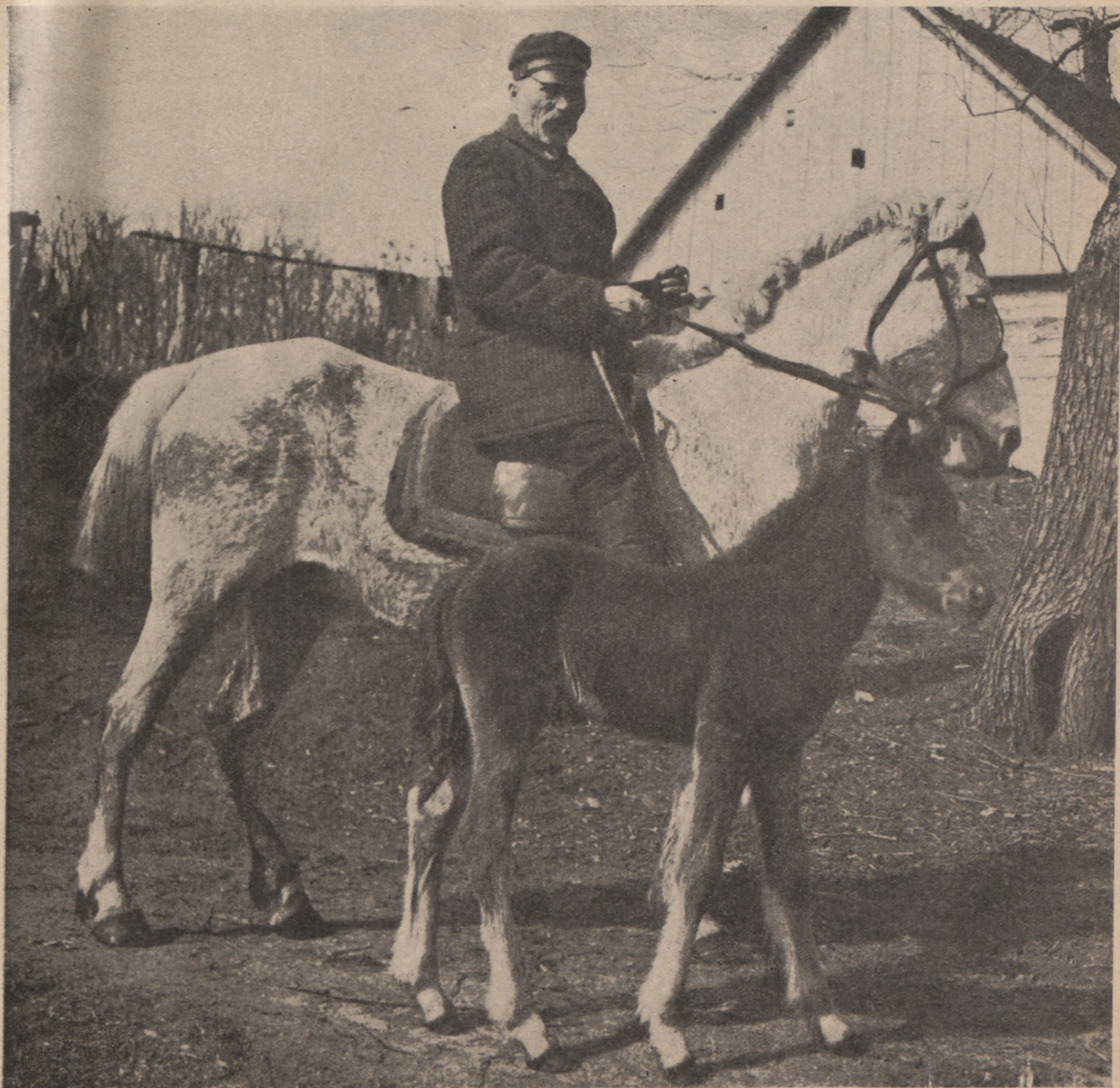
Pferdezucht in Litauen.