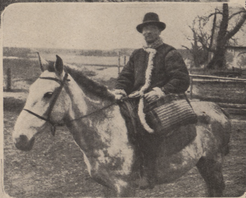
Auf dem Wege zur Stadt.

Ein feiner leichter Duft geht von ihm aus, wie er in ersten warmen Maiennächten herrscht, wenn der Nachtwind leise über den eben erblühten Fliederbusch im Garten