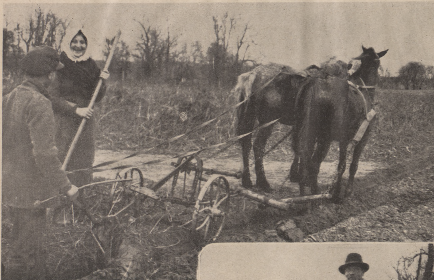
Die Bestellung des Ackers.