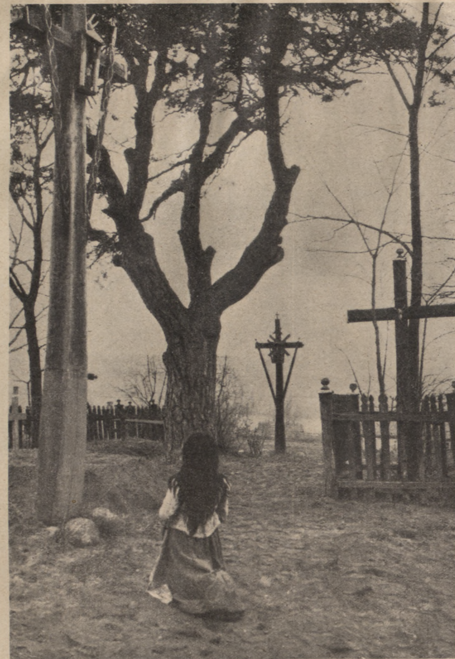
Auf einem litauischen Friedhof.

ten meines Herrn und Kaisers sind nicht gewohnt, ihre Sitze mitzunehmen!“ Damit verließ er stolz den Saal und ließ den Sultan und seine Umgebung höchst beschämt stehen.