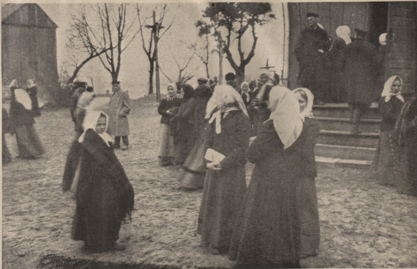
Kirchgang der Landbevölkerung in Litauen.

die Augen und trinke gierig den Fliederduft — sekundenlang.