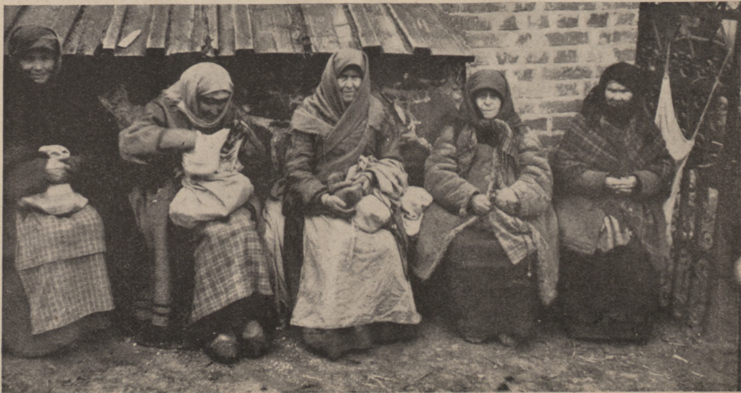
Almosenempfängerinnen vor der Kirche.