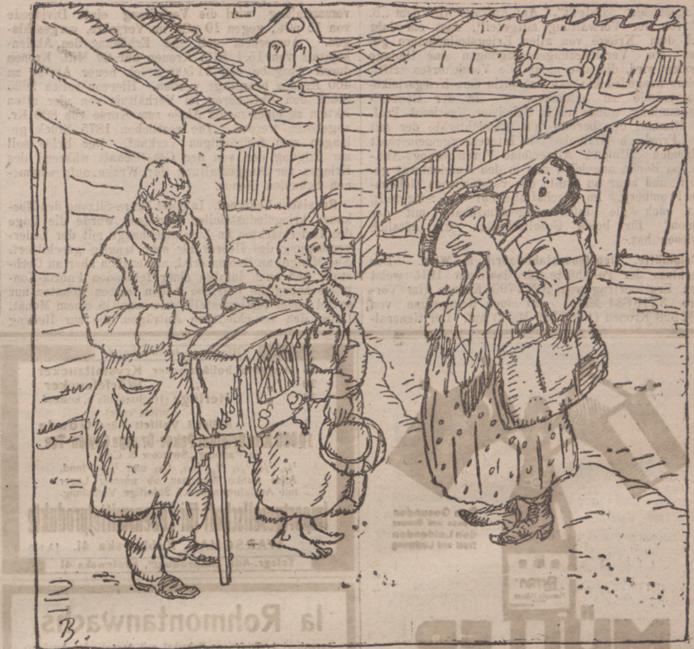
Hofkonzert in Wilna.