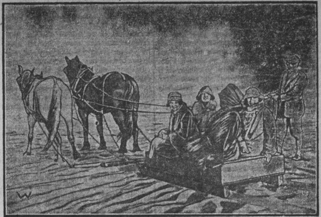
— SANKAMI PRZEZ PUSTYNIĘ SAHARĘ. Obrazek nasz przedstawia próbę jazdysaniami przez pustynię Saharę.

Jaskrawy fakt balamucenia ludu przez pisma warcholnie, o którym piszemy w dzisiejszym artykule wstępny, powinien nas zastanowić. Czyż my ciągle patrząc będziemy spokojnie, jak wiehryce, warchol i niesumienni pismacy wyzykiwać będą nieświadomość ludu dla zapchania swych własnych kieszeni koźmiem dobro-