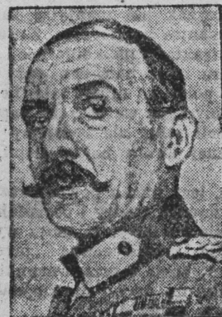
Dyktator Grecji Pangalos.