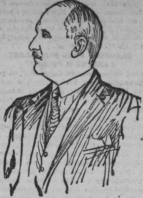
MINISTER SKARBU JERZY ZDZIECHOWSKI.

Jerzy Zdziechowski, ur. w r. 1880 ukończył akademię wyższych nauk handlowych w Antwerpii. Z chwilą wybuchu wojny w 1914 r. staje na czele komitetu obywatelskiego w Lubelskiem. W roku następnym, będąc na emigracji w Rosji, zostaje wiceprezesa naczelnej organizacji pomocy polskim uchodźcom i ofiarom wojny. W r. 1917 kieruje polskim wydziałem wojskowym rady zjednoczenia miedzypartyjnego w Rosji, następnie zajmuje się organizacją oddziałów polskich na Kaukazie. W r. 1919 powraca do kraju, bierze żywy udział w przemyśle i zostaje powołany na stanowisko wiceprezesa centralnego związku polskiego przemysłu, górnictwa, handlu i finansów.