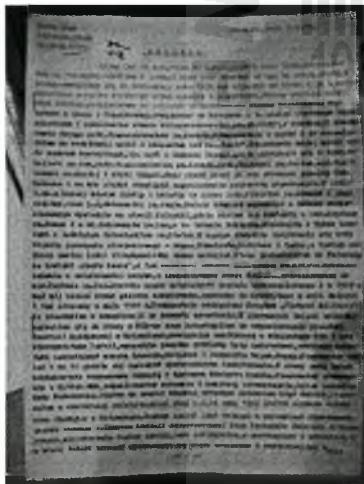
DSCN3485.JPG ~1,2 MB

Uprzejmie informujemy, że Instytut Pamięci Narodowej - KŚZpNP wywiązuje się z przepisów Rozporządzenia PE i Rady (UE) 2016/679 z 27 kwietnia 2016 r. w sprawie ochrony osób fizycznych w związku z przetwarzaniem danych osobowych i w sprawie swobodnego przepływu takich danych oraz uchylenia dyrektywy 95/46/WE (ogólne rozporządzenie o ochronie danych). Administratorem Pani/Pana danych osobowych jest Prezes IPN - KŚZpNP z siedzibą w Warszawie, adres: ul. Wołoska 7, 02-675 Warszawa. Pełna treść klauzuli informacyjnej jest opublikowana na stronie https://ipn.gov.pl/pl/edukacja-1/dla-nauczycieli . W przypadku braku Pani/Pana zgody na otrzymywanie kolejnych maili o podobnej tematyce, należy wysłać odpowiedź na tego maila o treści: "nie wyrażam zgody na dalszą korespondencję ze strony IPN-KŚZpNP".