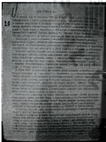
DSCN3470.JPG ~1.2 MB

Uprzejmie informujemy, że Instytut Pamięci Narodowej - KŚZpNP wywiązuje się z przepisów Rozporządzenia PE i Rady (UE) 2016/679 z 27 kwietnia 2016 r. w sprawie ochrony osób fizycznych w związku z przetwarzaniem danych osobowych i w sprawie swobodnego przepływu takich danych oraz uchylenia dyrektywy 95/46/WE (ogólne rozporządzenie o ochronie danych). Administratorem Pani/Pana danych osobowych jest Prezes IPN - KŚZpNP z siedzibą w Warszawie, adres: ul. Wołoska 7, 02-675 Warszawa. Pełna treść klauzuli informacyjnej jest opublikowana na stronie https://ipn.gov.pl/pl/edukacja-1/dla-nauczycieli . W przypadku braku Pani/Pana zgody na otrzymywanie kolejnych maili o podobnej tematyce, należy wysłać odpowiedź na tego maila o treści: "nie wyrażam zgody na dalszą korespondencję ze strony IPN-KŚZpNP".